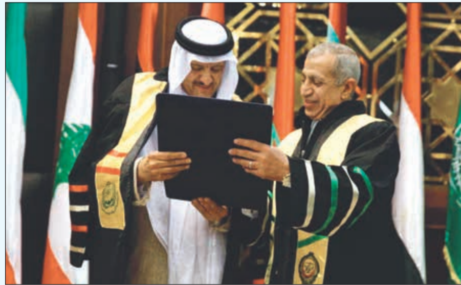
صاحب السمو الملكي الأمير سلطان بن سلمان لدى منحه الدكتوراه الفخرية

الإحساء، مؤكداً أن هذا الاختيار يؤكد مكانة الإحساء التاريخية والثقافية والسياحية وسيعزز زيادة وتنمية العوائد السياحية لمحافظة الإحساء خاصة والمنطقة الشرقية عامة. وأضاف آل فهد أنه تم منح الدكتوراه الفخرية لصاحب السمو الملكي الأمير سلطان بن سلمان بن عبدالعزيز الرئيس الفخري للمنظمة ورئيس الهيئة العامة للسياحة والتراث الوطني من الأكاديمية العربية للعلوم والتكنولوجيا والنقل البحري تقديراً لإنجازات سموه ودعمه للقطاع السياحي بالمملكة العربية السعودية وجهود سموه في تعزيز العمل العربي المشترك من خلال المجلس الوزاري العربي للسياحة، مؤكداً أن أسرة السياحة العربية تقدم تبريكاتها لسموه وأن هذا التكريم تكريم لقطاع السياحة العربية عامة والسياحة السعودية على وجه الخصوص لما قدمه سموه من جهود في تطويرها وتعزيزها.