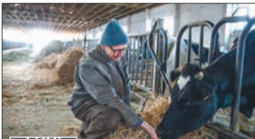
مزارع يربي ماشية في مزرعته