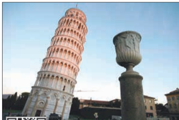
برج بيزا بدأ بناؤه في العام 1173

أ.ف.ب: للوهلة الأولى لا يبدو برج بيزا في منطقة توسكانة الإيطالية كأنه تغير فهو لا يزال مائلاً إلا أن مهندسين يعكفون على تصحيح الوضع مع تحسن ملحوظ في السنوات الأخيرة.