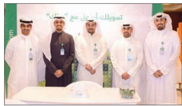
فريق «بيتك» في المعرض

ويؤكد مشاركة «بيتك» في المعرض للسنة الثامنة على التوالي، دوره الاقتصادي الرائد في تمويل البناء ودعم الحركة العمرانية التي تساهم في عملية التنمية ودفع عجلة الاقتصاد، لا سيما فيما يتعلق بالقطاعات الحيوية في البلد قطاع