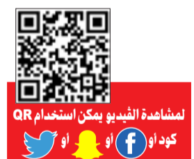
لمشاهدة الفيديو يمكن استخدام QR كود أو

القضاء المادة 16 وأصدر حكماً بإسقاط العضوية فإنه مع كل احترامى للقضاء ورجالاته والناس العاملين فيه فإن ذلك من صلاحيات مجلس الأمة إذا طلب النائب العام رفع حصانة عن أي نائب إن يرفض ولا تعتبر ذلك تجاوزاً على القضاء. وأوضح الدلال أنه لما بحثنا ودرسنا ووجدنا في الموضوع وجدنا أن فقهاء الدستور الكويتي بكتاباتهم منذ قيام الدستور حتى اليوم يعتبرون المادة 16 من صلاحيات وامتيازات مجلس الأمة ولا توجد فيه مخالفة دستورية. مشيراً إلى أنه إذا أراد البعض تعديل المادة فعليه السير بآلية التغيير لتعديلها لا الغائها. وامل الدلال إلا ينتقص من صلاحيات مجلس الأمة إلى يوم القيامة وليس في الوقت الحالي إنما نتكلم عن المستقبل وأهمية أن يبقى المجلس قوياً يمارس صلاحياته للأجيال القادمة لتمارس دورها التشريعي والرقابي على أحسن صورة. وأشار الدلال إلى أنه لو يصدر قرار بإلغاء العضوية لكل من النائبين الدكتورين وليد الطيببائي وجمعان الحربش وهناك أحكام صادرة من المحكمة الدستورية المؤقتة في الفترة الماضية وفي المحكمة الدستورية وفقاً للقانون لا تتدخل في الأعمال البرلمانية ولا قراراته، لافتاً إلى أن التدخل الآن هو تجاوز لصلاحيات المحكمة الدستورية مع كل احترام ويخرج عن الدور المطلوب بها. وشدد الدلال على أنه حرصاً على استقرار السلطات الدستورية والصلاحيات والامتيازات التي تتمتع بها كل سلطة من السلطات فإننا نامل من الأفاضل في المحكمة