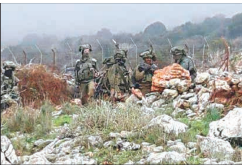
جنود الاحتلال منتشرين بين الصخور خارج السياج التقني في منطقة كروم الشرافي ميس الجبل

عواصم - وكالات: توعد نعيم قاسم نائب أمين عام حزب الله بضرب تل أبيب في حال قيام إسرائيل بأي عمل عسكري، محذراً من أنه لا توجد نقطة في إسرائيل إلا وهي في مرمى صواريخ حزب الله. وقال قاسم، في مقابلة مع صحيفة «الوفاق» الإيرانية: «قواعد الاشتباك التي أوجدها حزب الله في لبنان وقواعد الردع التي وضعها أمام إسرائيل صعبت كثيراً فكرة الحرب الابتدائية من إسرائيل على لبنان». وأضاف: «الآن الجبهة الداخلية الإسرائيلية معرضة حتى تل أبيب، ولا توجد نقطة في الكيان الصهيوني إلا وهي معرضة لصواريخ حزب الله».