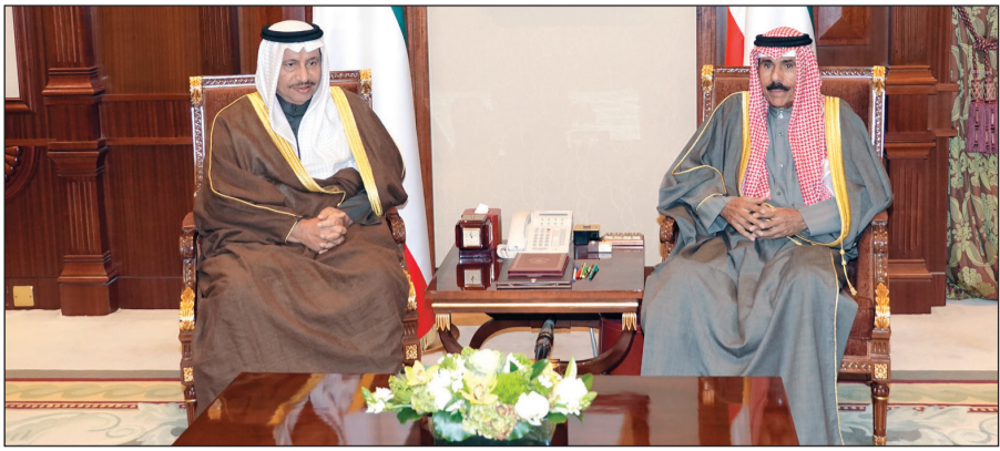
سمو ولي العهد الشيخ نواف الأحمد مستقبلاً سمو الشيخ جابر المبارك

استقبل سمو ولي العهد الشيخ نواف الأحمد بقصر بيان صباح أمس سمو رئيس مجلس الوزراء الشيخ جابر المبارك.