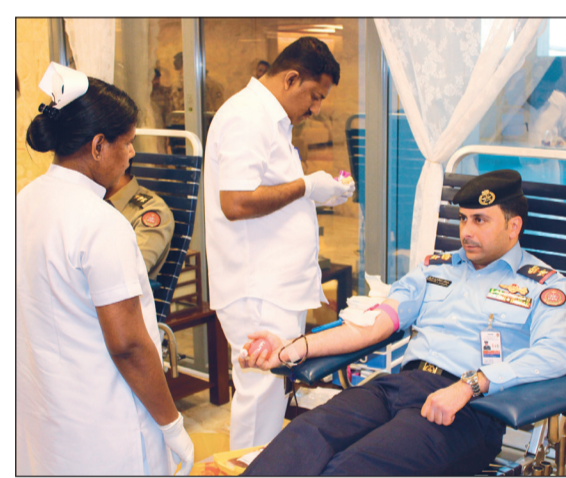
فحوصات طبية قبل التبرع

وتستمر حتى 16 الجاري. وأضاف الخضر أن هذه الحملة تهدف إلى تعزيز العطاء والتفاني لتلبية الاحتياجات الوطنية وتقديم كل أوجه الدعم والمساندة لمختلف وزارات ومؤسسات الدولة. بدوره، قال مدير التوجيه المعنوي والعلاقات العامة العميد الركن خالد الجطيلي في تصريح مماثل إن هذه الحملة تعد الأكبر من نوعها ضمن سلسلة حملات التبرع بالدم السابقة حيث تغطي مختلف وحدات الجيش. وأوضح الجطيلي أن الحملة