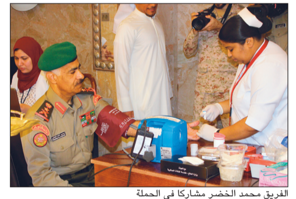
الفريق محمد الخضر مشاركاً في الحملة

تهدف إلى تلبية احتياجات بنك الدم ودعم مخزونه من فصول الدم المتنوعة من أجل تزويد جميع المستشفيات والمراكز الطبية في البلاد بها. يذكر أن بنك الدم الكويتي قام بتجهيز المعدات الطبية الخاصة بالتبرع واستقبال المتبرعين من منتسبي الجيش لإجراء الفحوصات الطبية اللازمة لهم قبل تبرعهم على التبرع وضمان جودة الدم المقبول، لاسمياً في ظل الإقبال الكبير من منتسبي الجيش على المشاركة في التبرع.