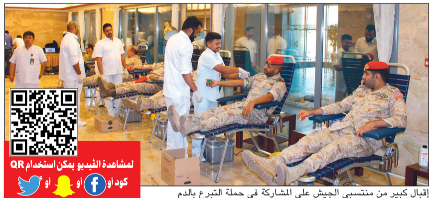
إقبال كبير من منتسبي الجيش على المشاركة في حملة التبرع بالدم