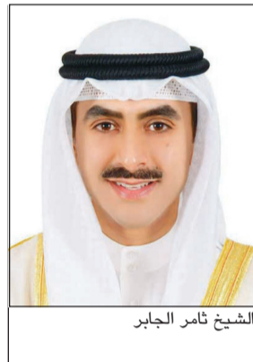
الشيخ ثامر الجابر

الرياض - (كونا): رفع سفيرنا لدى المملكة العربية السعودية الشيخ ثامر الجابر التهنية لخادم الحرمين الشريفين الملك سلمان بن عبدالعزيز وولي العهد نائب رئيس مجلس الوزراء وزير الدفاع السعودي صاحب السمو الملكي الأمير محمد بن سلمان والشعب السعودي الشقيق بمناسبة الذكرى الرابعة لتولي خادم الحرمين الشريفين مقاليد الحكم. وأكد السفير الشيخ ثامر الجابر في تصريح صحفي أمس