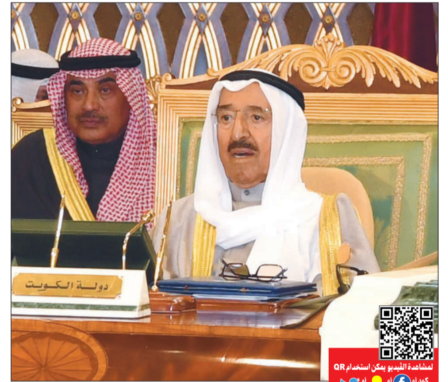
صاحب السمو الأمير الشيخ صباح الأحمد مترشحا وفد الكويت في قمة مجلس التعاون الخليجي الـ 39

خادم الحرمين افتتح قمة «الخليجي الـ 39» بتأكيد الحرص على صيانة كيان المجلس وتعزيز دوره في الحاضر والمستقبل