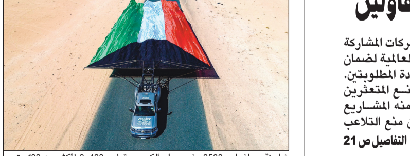
شاحنة سيلفراو 3500 رفعت علم الكويت بقياس 24,433 لاكثر من 100 متر دون أن يلمس أي جزء منه الأرض

«بيتك» يفتتح قاعة الزهراء المصرفية لخدمة عملاء «التميز» و«الرواد» 23