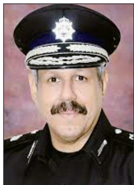
النواف الشيخ فيصل النواف

الرتب. ومن جهة أخرى، قال مصدر أمني رفيع المستوى إنه بات من المؤكد إحالة 4 قيادات أخرى للتقاعد خلال الأيام القادمة، وأضاف أن هناك زيادات مالية على الراتب الأساسي للسكريين وضباط وأفراد بعد موافقة اللجنة الرباعية.