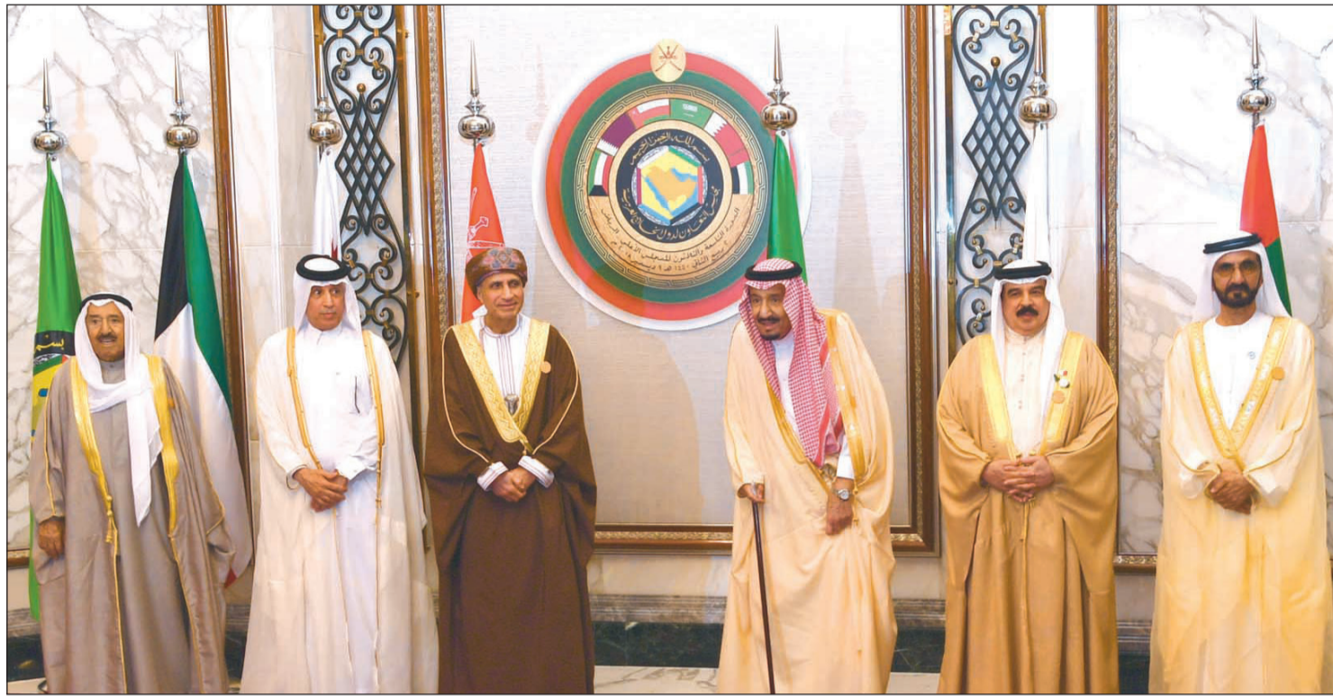
قادة وممثلو دول مجلس التعاون الخليجي في لقطة تذكارية قبيل انعقاد القمة

لمساعدة الفيديو يمكن استخدام QR كود أو أو أو