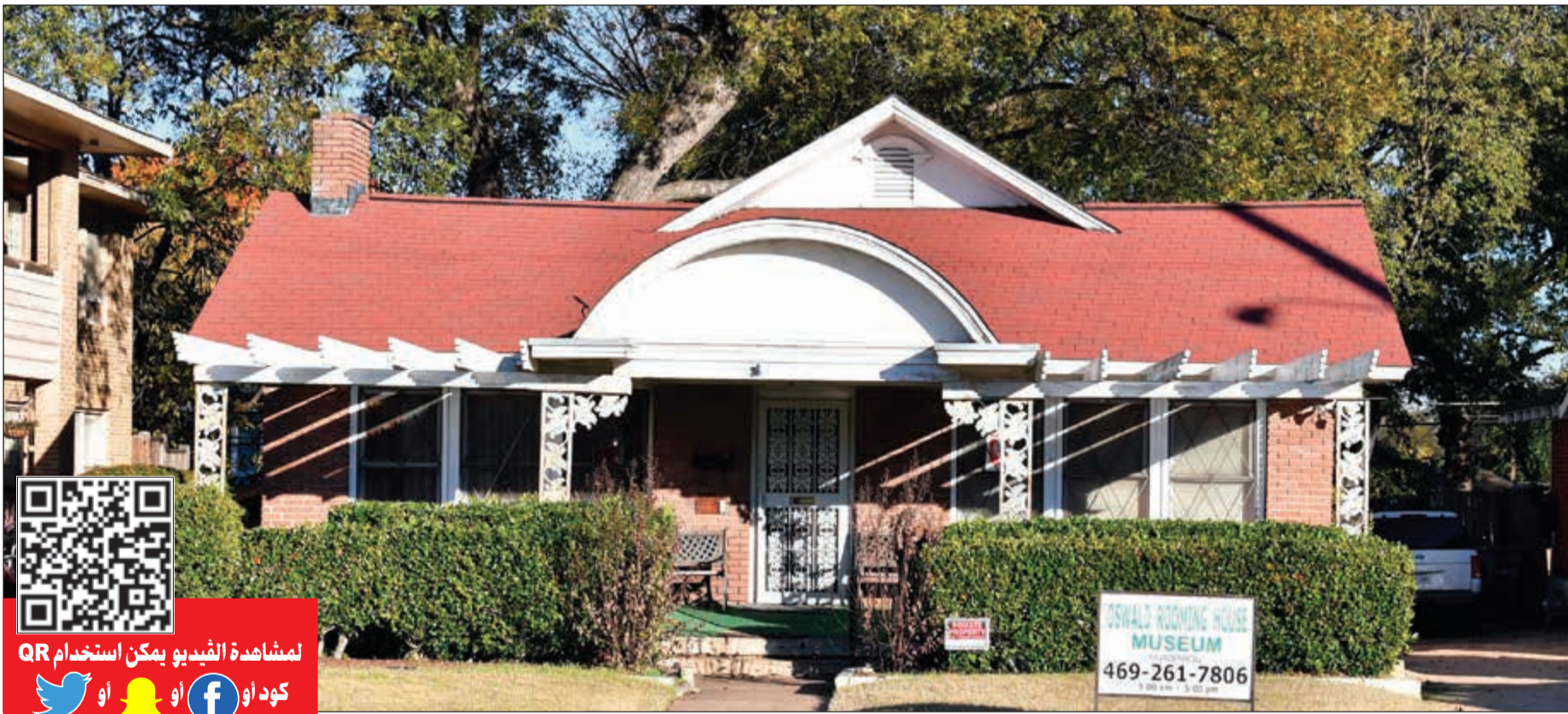
منزل أوزوالد في دالاس

يشير كثير من المحللين خاصة الذين يستندون الى