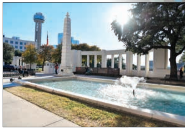
الباحة المقابلة لمبنى مستودع الكتب حيث كان يقف العديد من الشهود على الاغتيال