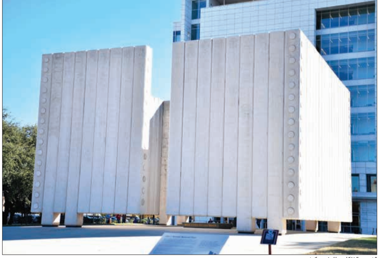
النصب التذكاري للرئيس كينيدي