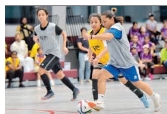
جانب من تدريبات سابقة لمنتخب السيدات للصالات

أزرق السيدات خلال الأشهر القليلة المقبلة، حيث ذكرت أنه عقب انتهاء الدوري سيتم ضم العديد من اللاعبات الجدد لمنتخب الصالات وفقا لما يقدمه بالدوري، كما سيقام معسكر تدريبي داخلي للمنتخب خلال الفترة المقبلة، ويعقبه مباراة ودية مع إحدى دول مجلس التعاون الخليجي. وأشارت إلى أن الاتحاد الدولي لكرة القدم وافق على تقديم الدعم لأربعة برامج لتطوير كرة القدم النسائية الكويتية، وهذا يشكل دما مهما للاتحاد، لافتة إلى عقد اجتماع تنسيقي للاتحاد دول الخليج لوضع البنود الأخيرة لتنظيم كأس الخليج 2019، بحضور البحرين وعمان والسعودية والعراق والإمارات والكويت البلد المستضيف.