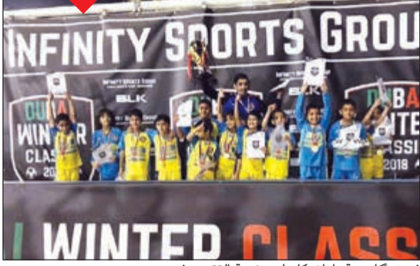
فريق أكاديمية بارازوكا على منصة التتويج في دبي