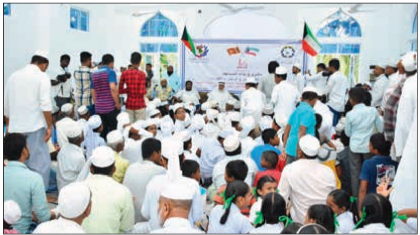
فرحة عارمة بالمسجد الجديد

والأجيال الشابة على موائد القرآن الكريم والسنة المحمدية، وتزرع في نفوسهم حب العمل الصالح، وتعزز كذاً القيم الإسلامية الوسطية التي حثنا عليها الشارح الحكيم. وأستشهد الخميس بحديث الرسول ﷺ «من بنى لله مسجداً بنى الله له بيتاً في الجنة»، معتبراً هذه الصفة واحدة من أفضل صفقات العمر، فمن خلال بناء مسجد في هذه الدنيا يبني رب العزة سبحانه لك بيتاً في جنات ونهر. ومن هنا أدعو أهل الخير والحسنيين والتجار إلى التسابق في دعم مشروع بناء المساجد، فهناك الكثير من المسلمين بحاجة شديدة لمسجد يمارسون فيه شعائرهم ويتعلمون الفضيلة وحسن الخلق.