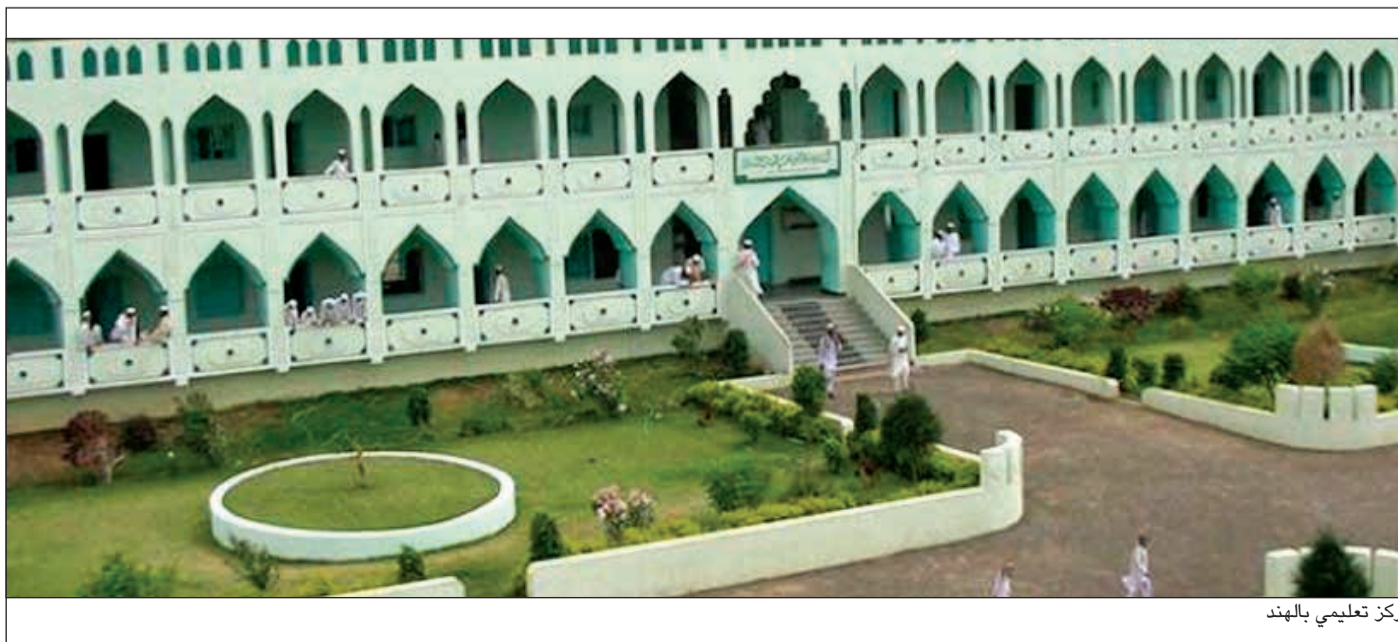
مركز تعليمي بالهند