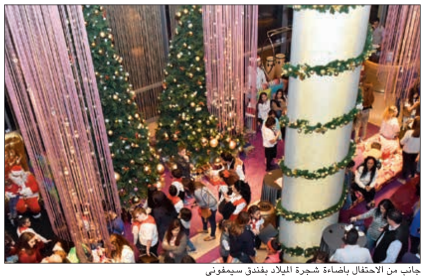
جانب من الاحتفال بإضاءة شجرة الميلاد بفندق سيمفوني