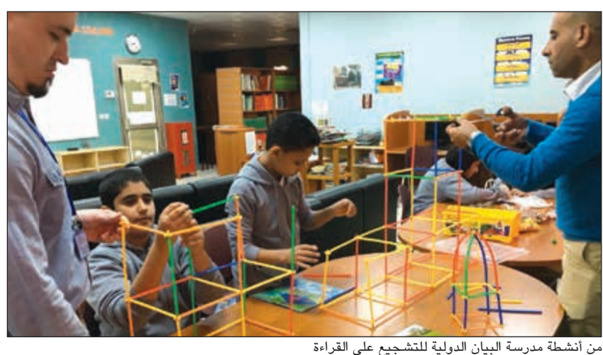
من أنشطة مدرسة البيان الدولية لتشجيع على القراءة

نظمت مكتبة مدرسة البيان الدولية فعاليات شهر القراءة، «نوفمبر شهر القراءة»، في المدرسة، والتي تهدف إلى تشجيع الطلاب على القراءة من خلال العديد من الأنشطة الممتعة لجميع الطلاب بمختلف المراحل الدراسية. وتم تزيين أبواب الفصول كغلاف كتاب، وتزينت المدرسة بالعديد من الملصقات واللافتات التي توضح أهمية القراءة، حيث احتوت اللافتات على أقوال مأثورة عن الكتب والقراءة، وأهم عناوين كتب اليافعين الحائزة على جوائز والتي يتوافر عدد منها في مكتبة المدرسة.