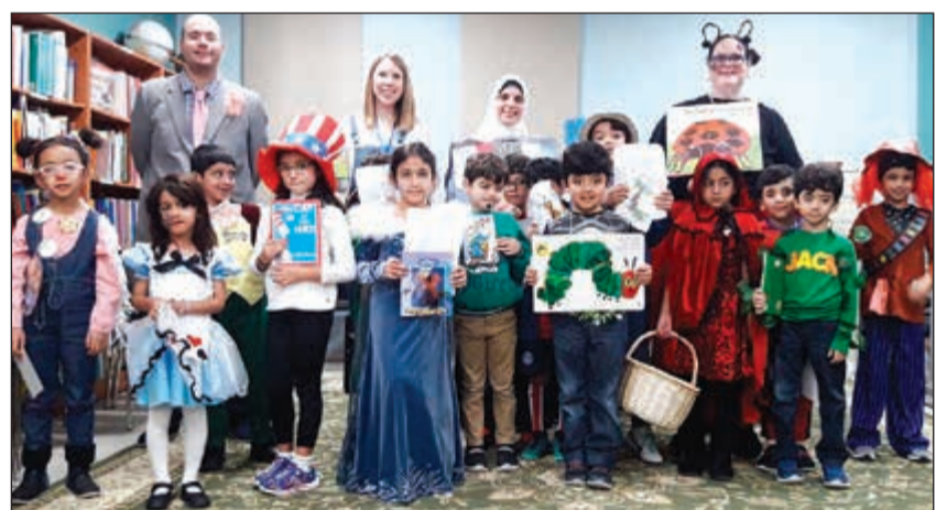
التشجيع على القراءة في مدرسة البيان الدولية