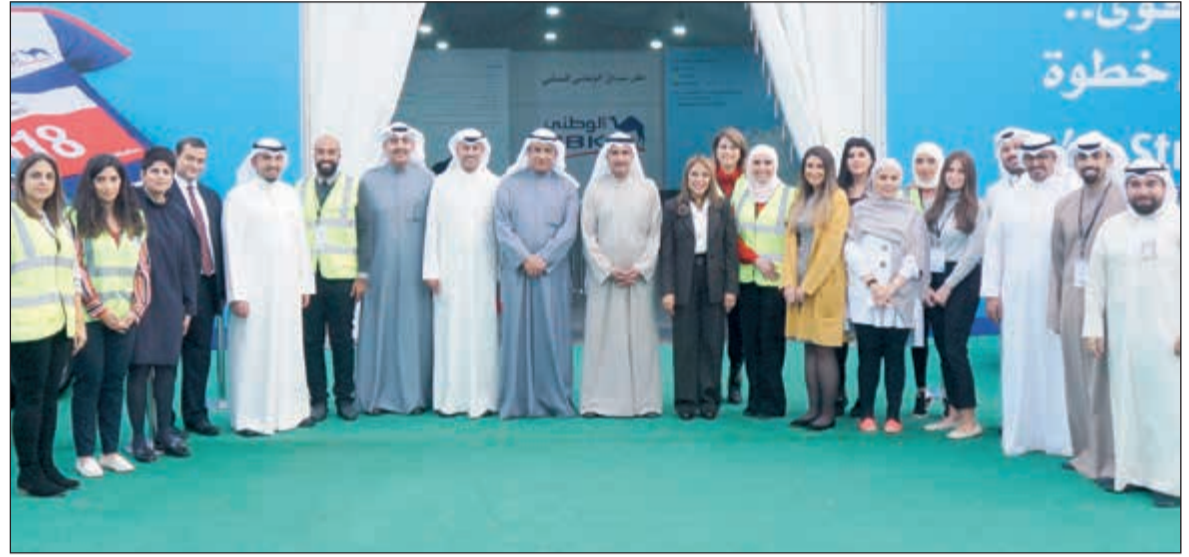
الإدارة التنفيذية في لحظة تذكارية خلال زيارة مركز تسجيل السباق

إلى جانب جوائز نقدية قيمة ومفاجآت وسحوبات فورية للمشاركة. وتقدم عدد من الجهات دعماً للسباق وفي مقدمتها الطوارئ الطبية ووزارة الداخلية ووزارة التجارة والصناعة وبلدية الكويت وشركة المشروعات السياحية إلى جانب الاتحاد الكويتي للعب القوي للهواة.