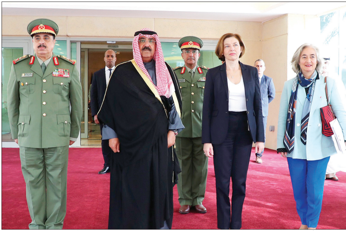
الشيخ مشعل الأحمد ووزيرة الجيوش بجمهورية فرنسا فلورنس بارلي والفريق الركن م. هاشم الرفاعي والسفيرة الفرنسية ماري ماس دوبوي