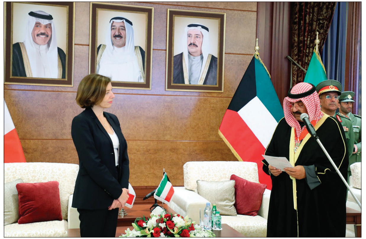
الشيخ مشعل الأحمد يلقي كلمته خلال اللقاء

صاحب السمو وولي العهد ورئيس الوزراء هناؤا نائب رئيس الحرس الوطني بمنحه الوسام تقديراً لدوره البناء في ترسيخ العلاقات الثنائية مع فرنسا