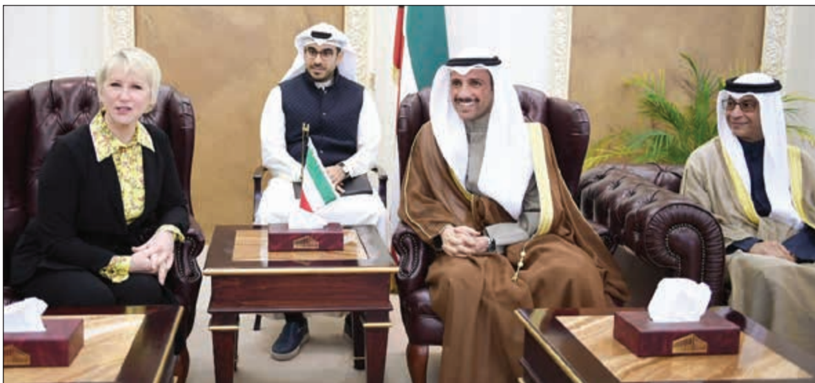
رئيس مجلس الأمة مرزوق الغانم خلال استقباله وزيرة خارجية السويد مارغو والستروم