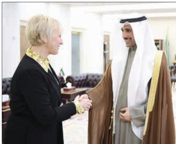
رئيس مجلس الأمة مرزوق الغانم مع وزيرة خارجية السويد مارغو والستروم