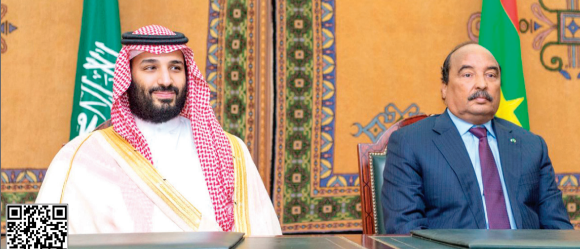
صاحب السمو الملكي الأمير محمد بن سلمان والرئيس الموريتاني محمد ولد عبدالعزيز يشهدان توقيع اتفاقيات تعاون في نواكشوط أمس

عقب مباحثاتها الرسمية، شهد الأمير محمد بن سلمان والرئيس محمد ولد عبدالعزيز توقيع 3 اتفاقيات ومذكرات تفاهم بين البلدين، تتعلق بتجنّب الأزواج الضريبي، والتعاون في مجال المياه والصرف الصحي، والحياة الفطرية. وفي سياق متصل، أعلن وزير الإعلام السعودي د.عواد العواد عن توجيه سلمان بن عبدالعزيز بأشياء مستشفي الملك سلمان في نواكشوط بسعة 300 سرير.