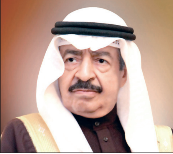
صاحب السمو الملكي الأمير خليفة بن سلمان رئيس وزراء البحرين

من إرادة ملكية سامية ورضا من قبل المواطنين، مؤكداً أن الجمع على استعداد للمزيد من البذل والعطاء في سبيل الوطن وشعبه، معرباً عن تقديره البالغ لعطاء كل عضو في الوزارة وعلى تفانيهم وأخلاصهم مما انعكس على مستوى ونوعية المنتج الحكومي في كل جوانبه، وأكد أن ما حققناه مهما بلغ مداه وصداه إلا أن طموحاتنا ما زالت تتوحدنا نحو ما هو أفضل وأعلى مرتبة للوطن والمواطن. وأعرب عن خالص التحاني إلى أعضاء مجلس النواب على الثقة التي منحها إياهم الشعب، آملاً لهم التوفيق في حمل هذه الأمانة والمسؤولية.