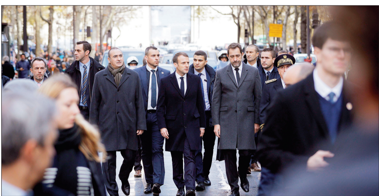
الرئيس الفرنسي إيمانويل ماكرون ووزير الداخلية كريستوف كاستانير خلال تفقد أحد شوارع باريس عقب المظاهرات أمس

مصورة والمحتجون يهتفون بعبارة «ارحل.. ارحل». ورغم الهتافات المعارضة له وسياساته، استكمل ماكرون جولته في كلبيه بزيارة التجار المتضررين من المظاهرات. بوردو، أعلن مجلس الشيوخ الفرنسي أمس أنه سيستمع غداً أمام لجنة إلى الوزيرين المكلفين بالأمن للحصول على إيضاحات عن الوسائل التي نشرها وزير الداخلية، في مواجهة الفوضى من جانبه، لم يستبعد وزير الداخلية الفرنسي كريستوف كاستانير فرض حالة الطوارئ في البلاد بناء على طلب عدد من النقابات والشرطة، وقال مساء أول من أمس «ندرس كل الإجراءات التي نستسمح لنا بفرض مزيد من الإجراءات لضمان الأمن»، مضيفاً «لا ضمانات لدي، وأنا مستعد للنظر في كل شيء». وقال كاستانير إن مرتكبي أعمال العنف في باريس هم من «مثيري الانقسام والشغب» وأضاف «تم التعرف على حوالي 3000 شخص تحولوا في باريس» وارتكبوا مخالفات «مما جعل تدخل قوات حفظ جولته في كلبيه بزيارة التجار المتضررين من المظاهرات. بوردو، أعلن مجلس الشيوخ الفرنسي أمس أنه سيستمع غداً أمام لجنة إلى الوزيرين المكلفين بالأمن للحصول على إيضاحات عن الوسائل التي نشرها وزير الداخلية، في مواجهة الفوضى من جانبه، لم يستبعد وزير الداخلية الفرنسي كريستوف كاستانير فرض حالة الطوارئ في البلاد بناء على طلب عدد من النقابات والشرطة، وقال مساء أول من أمس «ندرس كل الإجراءات التي نستسمح لنا بفرض مزيد من الإجراءات لضمان الأمن»، مضيفاً «لا ضمانات لدي، وأنا مستعد للنظر في كل شيء». وقال كاستانير إن مرتكبي أعمال العنف في باريس هم من «مثيري الانقسام والشغب»