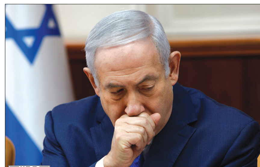
رئيس وزراء الاحتلال بنيامين نتنياهو

عواصم - وكالات: قالت الشرطة الإسرائيلية أمس ان تحقيقها توصل إلى أدلة كافية لتوجيه اتهامات الرشوة والاحتيال إلى رئيس الوزراء بنيامين نتنياهو وزوجته بمنحها صفقة تفضيلية لشركة بيزك للاتصالات مقابل تغطية أكثر إيجابية له ولزوجته على موقع «والا» الإخباري المملوك للشركة في ثالث قضية فساد ضدّه. وقالت الشرطة في بيان مشترك مع سلطة الأوراق المالية الإسرائيلية أنها توصلت أيضاً إلى ما يكفي من الأدلة لاتهام المساهم صاحب الحصة المسيطرة في بيزك بالرشوة، وكذلك مسؤولون آخرون في الشركة. وجاء في البيان «الاشتباه الرئيسي هو أن رئيس الوزراء تلقى رشي وتصرف بشكل ينطوي على تضارب في المصالح بالتدخل واتخاذ قرارات تنظيمية لصالح شاؤول الوفيتش وبيزك وبالتالي مع ذلك طلب بصورة مباشرة وغير مباشرة التدخل في محتوى موقع والا عواصم - وكالات: قالت الشرطة الإسرائيلية أمس ان تحقيقها توصل إلى أدلة كافية لتوجيه اتهامات الرشوة والاحتيال إلى رئيس الوزراء بنيامين نتنياهو وزوجته بمنحها صفقة تفضيلية لشركة بيزك للاتصالات مقابل تغطية أكثر إيجابية له ولزوجته على موقع «والا» الإخباري المملوك للشركة في ثالث قضية فساد ضدّه. وقالت الشرطة في بيان مشترك مع سلطة الأوراق المالية الإسرائيلية أنها توصلت أيضاً إلى ما يكفي من الأدلة لاتهام المساهم صاحب الحصة المسيطرة في بيزك بالرشوة، وكذلك مسؤولون آخرون في الشركة. وجاء في البيان «الاشتباه الرئيسي هو أن رئيس الوزراء تلقى رشي وتصرف بشكل ينطوي على تضارب في المصالح بالتدخل واتخاذ قرارات تنظيمية لصالح شاؤول الوفيتش وبيزك وبالتالي مع ذلك طلب بصورة مباشرة وغير مباشرة التدخل في محتوى موقع والا