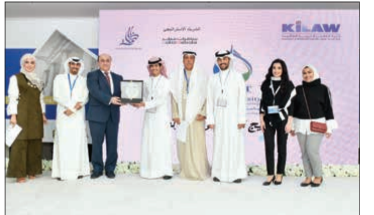
فريق جامعة الخليج للعلوم والتكنولوجيا الفائز بالمركز الأول