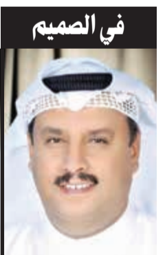
م. غنيم الزبيعي @ghunaimalzu3by

ولو أطلقنا اسم «جورج بوش الأب» على أحد شوارع الكويت كان أوفى واجمل، فمن لا يشكر الناس لا يشكر الله.