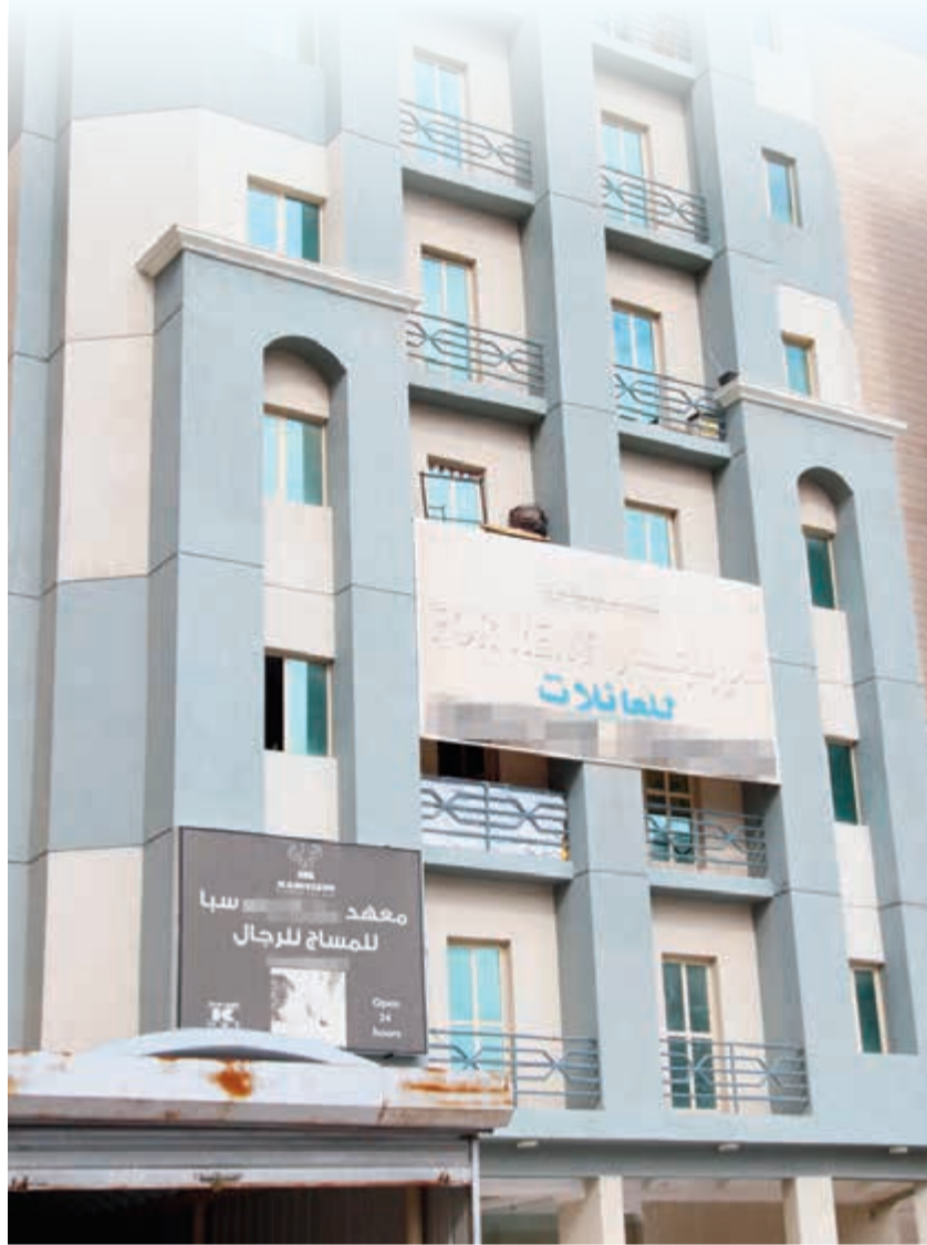
لافتات شقق للإيجار تعود في أغلب مناطق الكويت (عادل سلامة)