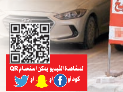
لمشاهدة الفيديو يمكن استخدام QR كود أو

وأقامت «الأنباء» بجولة ميدانية لمعرفة آخر ما وصل إليه القطاع الاستثماري حيث التقت بعدد من المستأجرين وحراس العقارات لمعرفة أسباب تواجد عدد كبير من الشقق