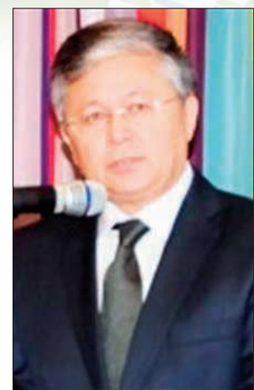
سفير أوزبكستان في الكويت د.بهرمجان أعلايوف