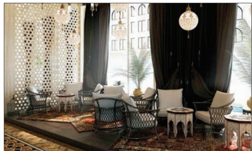
بهو فندق 3 نجوم يعكس مستوى الفخامة والرفي في فنادق أوزبكستان