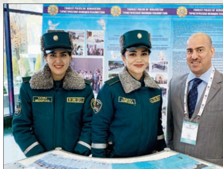
الشرطة السياحية في طشقند

سبق وزرت أوزبكستان في أواخر عام 2011، تجولت في مدنها الثلاث