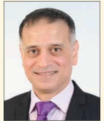
إعداد: د. طارق البكري

التواصل مع الصفحة بصفحة: «الانباء» على البريد الإلكتروني: DOCBANKRI@YAHOO.COM | الهاتف: 97660918