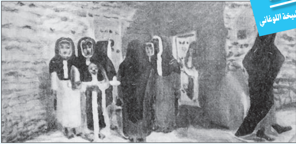
لعبة «أم الغيث» كما رسمها الفنان أيوب حسين الأيوب

أهزوجة شعبية كويتية تتغنى بها الفتيات طلبا لنزول المطر