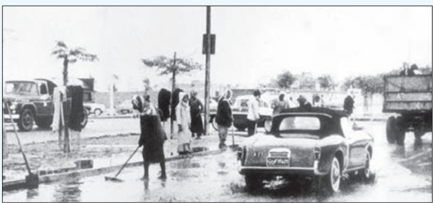
المطر في الكويت قديما

وبين القطان أن كل بيت من بيوت (الفرجان) - أي الأحياء القديمة - الذي كانت تقف عنده الفتيات كان يقوم بإعطائهن «المقسوم» أي هدية بسيطة من السلوق أو الخبز أو الرز وأحيانا بعض النقود القليلة عندما يكون أصحاب المنزل من المقتدرين مالياً. وأضاف أن كل ذلك كان يقصد به تسليية الصغار والمشاركة في لعب وهو الفتيات بحسن نية دون الاعتقاد الحازم بأن المطر سوف ينزل بأهزوجة (أم الغيث) فأهل الكويت كانوا على إيمان وعلم بأن المطر ينزل بأمر من الله سبحانه وتعالى. في السياق ذاته، جاء في كتاب الفنان الكويتي الراحل أيوب حسين الأيوب «العابنا الشعبية الكويتية» أن للفتيات الصغيرات دورهن الفعال في التقدم بالدعاء قديما لطلب إنزال الغيث حيث