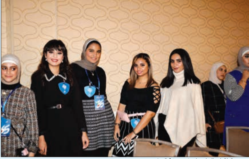
عدد من الطالبات الحاضرات في ورشة العمل