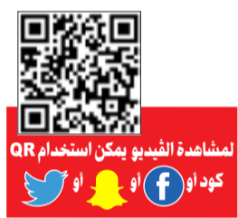
لمشاهدة الفيديو يمكن استخدام QR كود أو

أ - القانون رقم 61 لسنة 1976 المشار إليه النصوص التالية: مادة 17: يستحق المعاش التقاعدي في الحالات التالية: 1 - انتهاء خدمة المؤمن عليه بسبب الوفاة ولم يكن خاضعاً لأحكام الباب الخامس من هذا القانون أو لأحكام قانون المعاشات ومكافآت التقاعد للعسكريين رقم 69 لسنة 1980 حالة استحقاق المعاش التقاعدي بعد انتهاء الخدمة خصم ما يكون قد صرف للمؤمن عليه من مكافأة التقاعد التي استحققت عند انتهاء الخدمة خصماً من المعاش التقاعدي بواقع 10٪ شهرياً ويتم الخصم من أصل المعاش قبل توزيعه على المستحقين في حالة الوفاة. 2 - انتهاء خدمة المؤمن عليه بسبب استفاد الإجازة المرضية أو عدم اللياقة للخدمة صحياً. مادة 59: يستحق المعاش التقاعدي في الحالات الآتية: 1 - وفاة المؤمن عليه أو ثبوت عدم لياقته صحياً قبل انتهاء الاشتراك أو خلال مدة لا تتجاوز سنتين من تاريخ انتهائه ولم يكن خاضعاً لأحكام الباب الثالث من هذا القانون أو لأحكام قانون معاشات ومكافآت التقاعد للعسكريين رقم 69 لسنة 1980 وبحسب المعاش في هذه الأحوال على أساس مدة الاشتراك المحسوبة في هذا التأمين أو خمس عشرة سنة أيهما أكبر وتضاف إلى مدة الاشتراك في التأمين في حالة الوفاة أو عدم اللياقة الصحية قبل انتهاء الاشتراك المدة الباقية حتى بلوغ المؤمن عليه سن الستين فرضاً. 2 - بلوغ المؤمن عليه سن الخمسين متى بلغت مدة الاشتراك المحسوبة في هذا التأمين عشرين سنة ويصرف للمعاش: أ - الاشتراكات التي يؤديها المؤمن عليه طبقاً لشرحية الدخل الشهري التي يختارها من الجدول رقم 6 المرفق على أن يتضمن الجدول: 1 - شرائح تصل 1500 دينار للاشتراك الأساسي، وأن يضاف 1250 راتباً تكملياً. 2 - تحدد نسبة الاشتراك