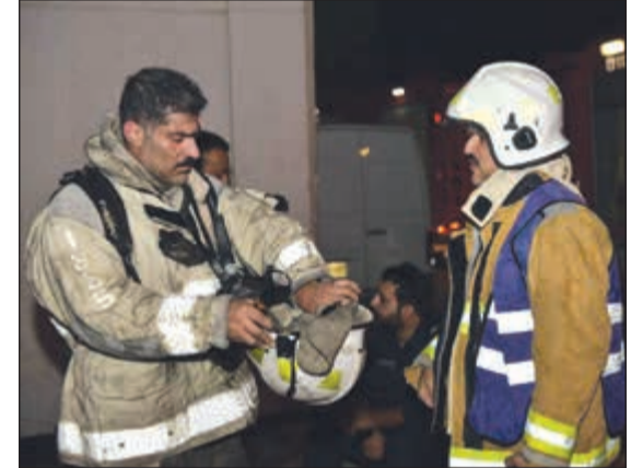
رجال إطفاء واستراحة محارب

وجار التحقيق لمعرفة أسباب الحريق. وتواجد في موقع الحادث رجال الأمن والطوارئ الطبية.