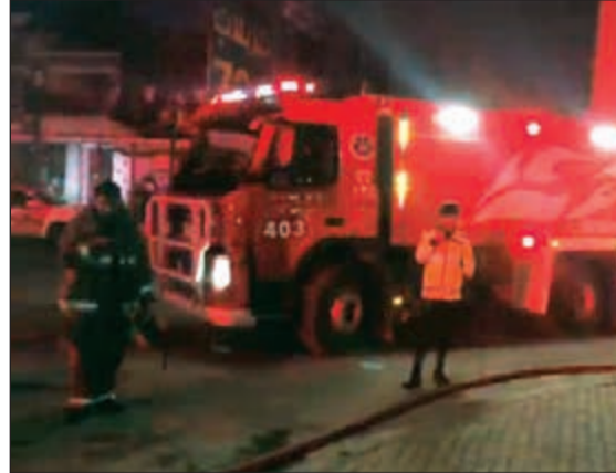
آليات الإطفاء تساهم في إخماد الحريق