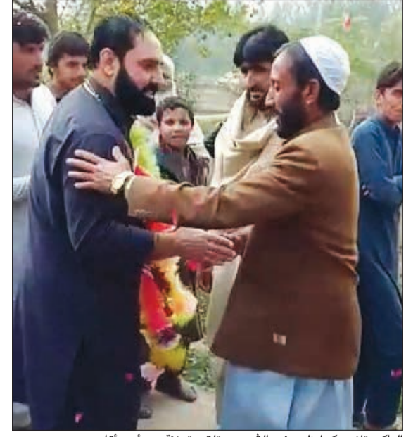
الباكستاني كما ظهر في الفيديو يتلقى تهنئة من أحد أقاربه

بعودته من الكويت. وتساءل صاحب الحساب عن صحة المقطع والخبر