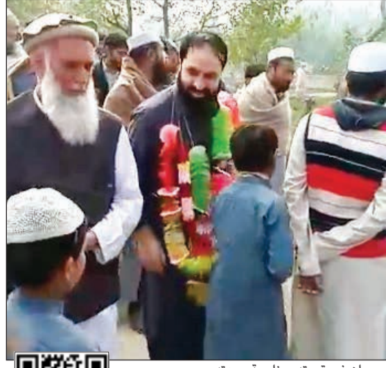
مهرجان في قريته بمناسبة عودته

أكد نائب رئيس مجلس الوزراء وزير الداخلية الشيخ خالد الجراح عمق العلاقات بين الكويت وجمهورية رومانيا، مثمناً الدور الذي يقوم به رئيس جهاز المخابرات الخارجية بها لتوطيد العلاقات بين البلدين. جاء ذلك خلال استقبال الجراح بكميته في مبنى وزارة الداخلية بمنطقة صباح صباح امس رئيس جهاز المخابرات الخارجية في رومانيا غابرييل فلاح، بحضور وكيل وزارة