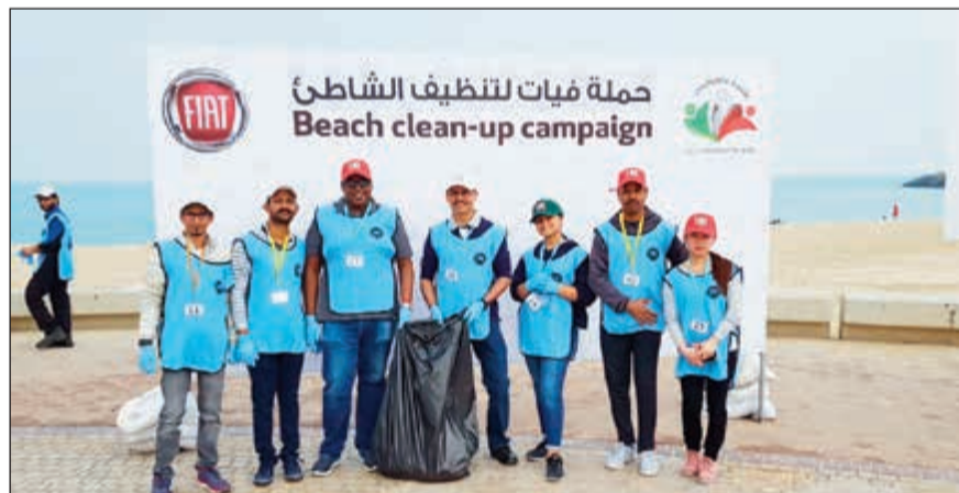
لقطة جماعية لعدد من المشاركين في حملة تنظيف الشاطئ

ريفولي وسعادة جوزيبي سكوتيايميليو، السفير الإيطالي لدى الكويت، وجمعة من المشاركين في حملة تنظيف الشاطئ، وتم انجاز المهمة بنجاح