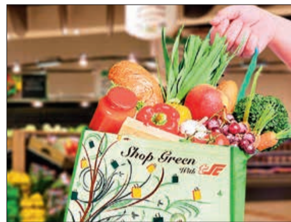
مركز سلطان وجهود لحماية البيئة