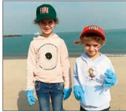
مشاركة منذ الصغر للحفاظ على البيئة