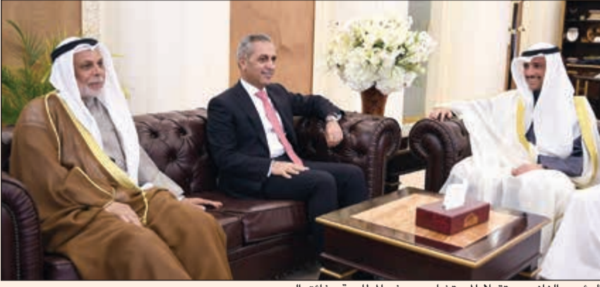
الرئيس الفانم يستقبل المستشار يوسف المطارة وفائق العبدوي

الدستورية المستشار يوسف المطارة يرافقه رئيس مجلس القضاء الأعلى في جمهورية العراق فائق زيدان العبدوي الذي حضر اللقاء النواب مبارك الشطي وأحمد الفضل ومجد المطيري وسعدون حماد العتيبي.