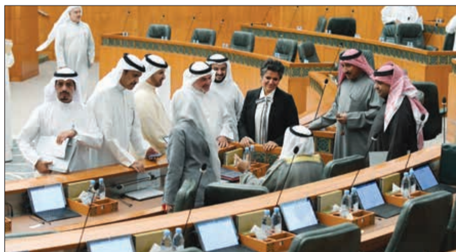
الشيخ ناصر صباح الأحمد محامياً بالنواب

وأوضح الرويعي أن رئيس مجلس الأمة موجود مع صاحب السمو الأمير في افتتاح مستشفى جابر، مضيفاً «سنستكمل في الجلسة المقبلة جدول الأعمال». وكان مدرجاً على جدول أعمال الجلسة التكميلية تقارير اللجنة التشريعية بشأن طلبات رفع الحصانة عن 3 نواب، وطلبي مناقشة بشأن تداعيات سوء مصفاة الزور، وندب مجموعة من العسكريين للعمل لدى أعضاء مجلس الأمة.