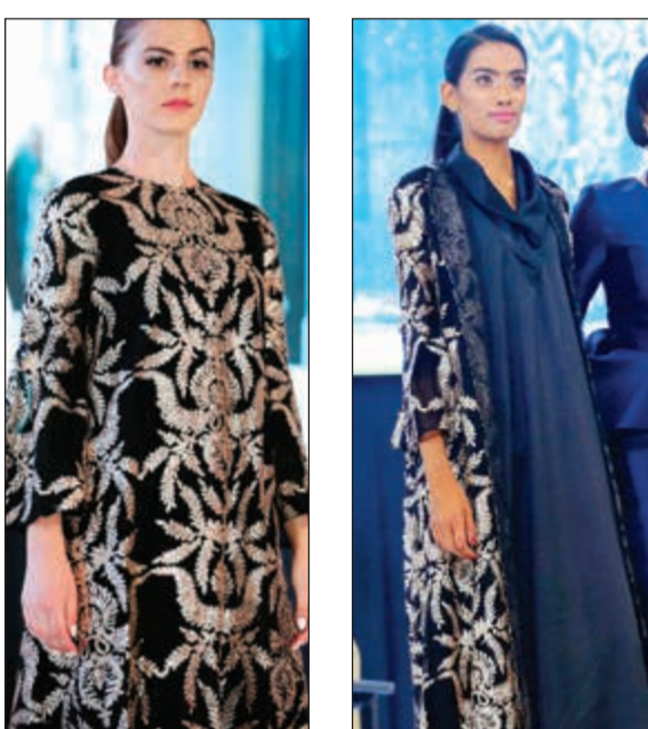
كفتان مذهب راق