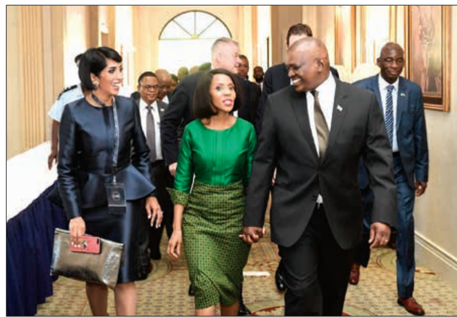
رئيس بوتسوانا وجرمه وحديث مع بلسم الأيوب