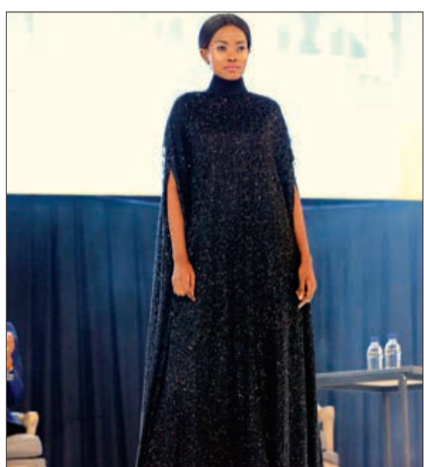
كفتان أسود مطرز