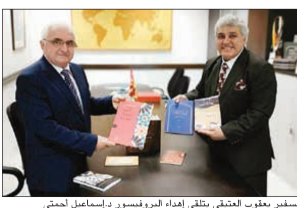
السفير يعقوب العتيقي يتلقى إهداء البروفيسور د.إسماعيل أحمتي

إسماعيل أحمتي لدوره في تطور وتوطيد العلاقات الثنائية بين الكويت وجمهورية مقدونيا، وقال العتيقي في تصريح صحفي «إنني أشعر بالفخر في لقائي مثل شخصية البروفيسور د.إسماعيل أحمتي والذي يعتبر رمزا وجسرا حقيقيا للتعاون والتطور والتقدم في وضع أسس للثقافة، من جانبه جبر البروفيسور د.إسماعيل أحمتي عن شكره وامتنانه للسفير العتيقي