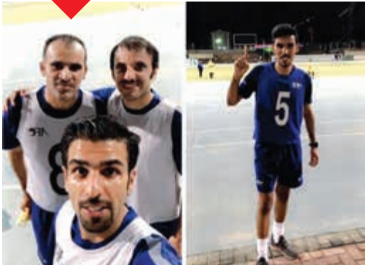
نجاح مميز لحكام الكويت في اختبارات الآسيوية