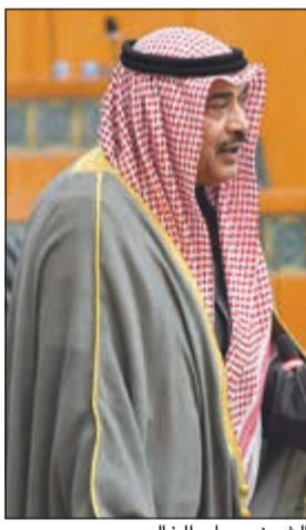
الشيخ صباح الخالد