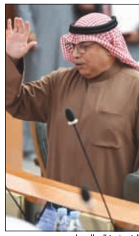
الشيخ خالد الجراح

يتحقق بالا استقرار واكث المكرة التنفيذية وجاءت قرارات المحكمة الدستورية على أن السياسة العامة تكون في حدود ضيقة ولا تكون في العمل التنفيذي.