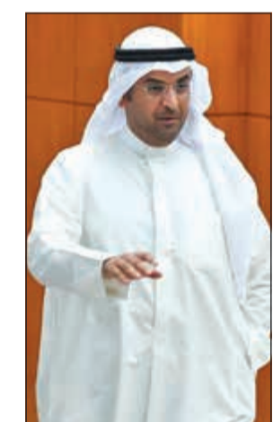
د. نايف الحجرف