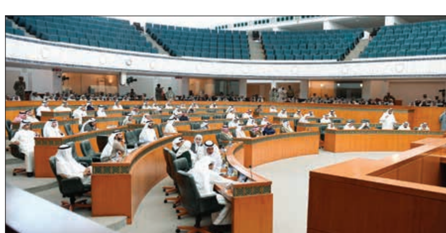
جانب من الجلسة