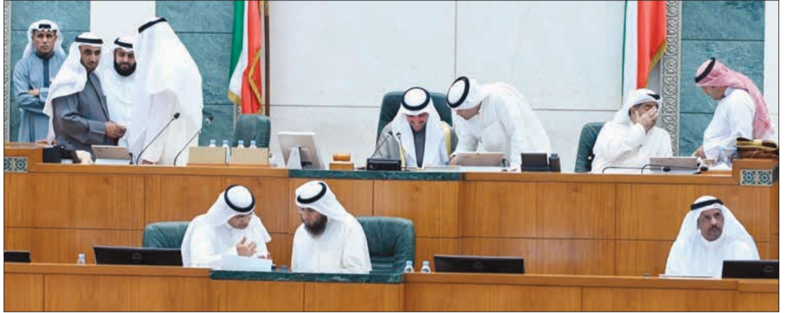
رئيس مجلس الأمة مرزوق الغانم وعمر الطبطبائي وفيسل الكندري ود. عودة الرويعي ومحمد الدلال وعبدالله فهد على المنصة

بالإشارة إلى قرار مجلس الأمة بجلسته المنعقدة يوم الثلاثاء الموافق 2018/5/15 بتكليف لجنة الشؤون الداخلية والدفاع أعداد تقاريرها عن الاقتراحات بقوانين المتعلقة بالية التصويت والنظام الانتخابي والناشر الانتخابية وشروط الترشح على أن تقدم اللجنة تقاريرها عن هذه الموضوعات قبل بداية دور الانعقاد الحالي.