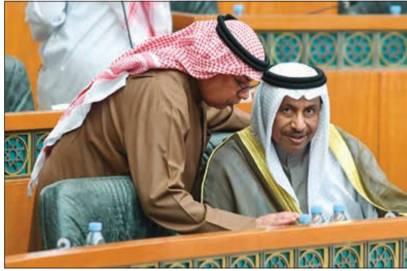
سمو رئيس الوزراء الشيخ جابر المبارك والشيخ خالد الجراح