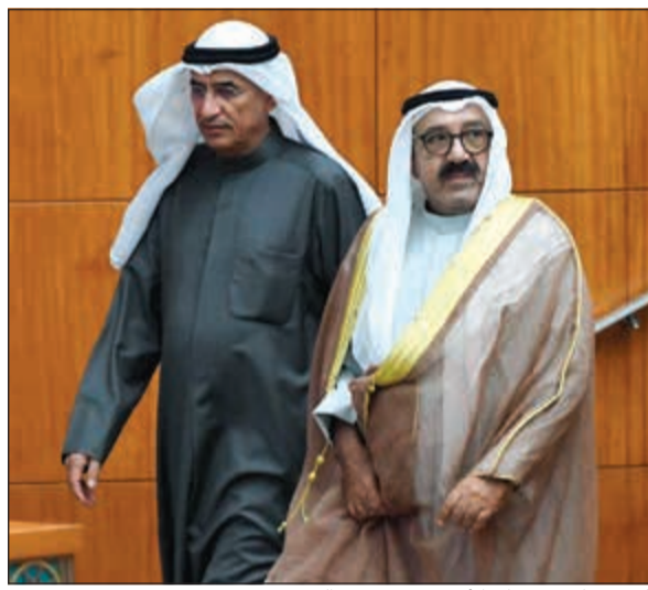
الشيخ ناصر صباح الأحمد وم. بخيت الرشيد