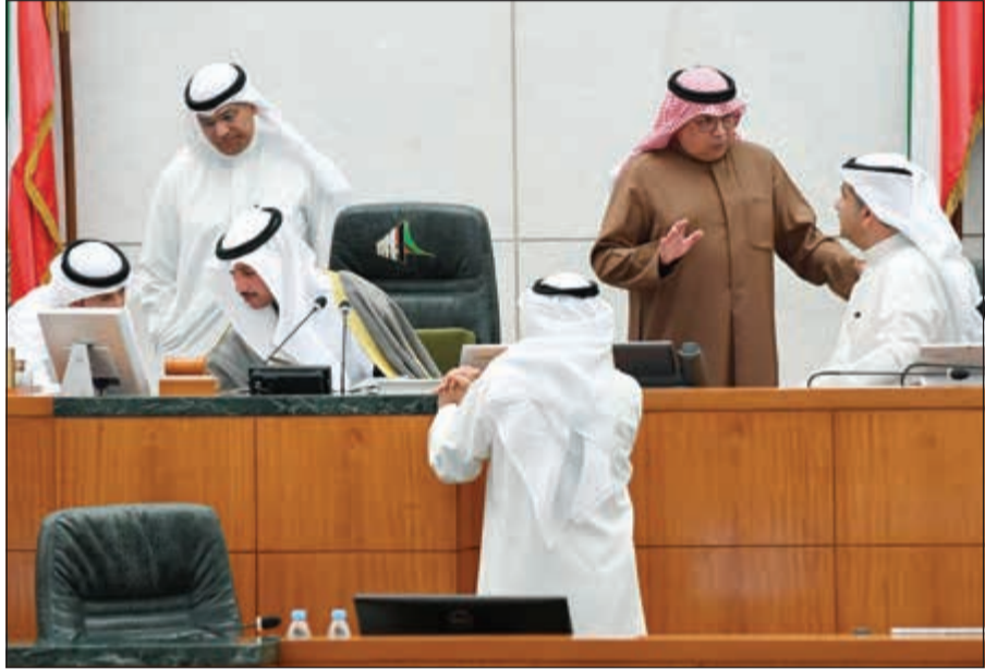
الرئيس الغانم والشيخ خالد الجراح ود. عودة الرويعي