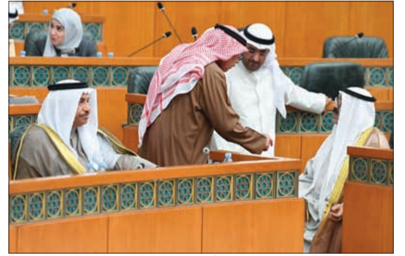
سمو الشيخ جابر المبارك والشيخ ناصر صباح الأحمد والشيخ خالد الجراح ود. نايف الحجرف

الإحالة للتشريعية وكانت النتيجة كالتالي: الحضور 63، الموافق 41، عدم الموافقة 20، لم يصوت العدساتي، فهاد. بحال الاستجواب إلى اللجنة التشريعية. ● مرزوق الغانم: سنبداً غداً بالحصانات. 1- طلب مناقشة دواعي أسباب نذب مجموعة من العسكريين للعمل لدى نواب الأمة ومدى توافقها مع الأحكام القانونية. ● موافقة على مناقشة الطلب ساعة في جلسة الغد. 2- طلب مناقشة تداعيات فضيحة سوء تصميم صفاة الزور التي تكبد الدولة خسائر تفوق 15 مليار دينار. وزير النفط: اشكرهم على حرصهم على المشاريع النفطية ووافق المجلس على مناقشة الطلب في ساعتين. 3- هناك طلب مناقشة التقاعد المبكر ولكن الوزير غداً مسافر في مهمة رسمية فلن ادرج التقرير وسناقش الجلسة المقبلة في 12/11. (موافقة عامة) 4- محمد الدلال: لدينا طلب مناقشة 4 قوانين منها القياديين والتقاعد. ● مرزوق الغانم: خلنا ننسّق أخ محمد. ● صلاح خورشيد: مستعدون لمناقشة تقرير التقاعد المبكر في أي وقت. ● مرزوق الغانم: ترفع الجلسة التي صباح يوم غد الساعة التاسعة صباحاً.