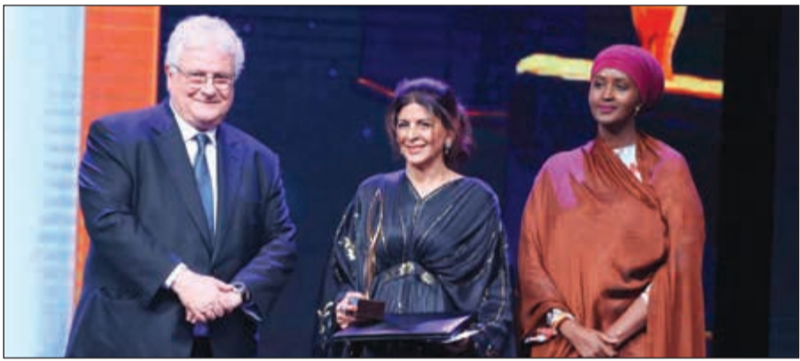
قارة السكاف لدى تكريمها

على هاتين الحقيقتين، واختياري اليوم إنما جاء نتيجة لنجاح مشروع بدأ في الكويت وحقق نجاحاً وصيماً طيباً فيها ثم في عدد من الدول العربية، وهذا المشروع اسمه «لويك»، أما الحقيقة الرابعة فهي أن نجاح العمل المؤسسي لا يمكن أن ينسب لجهود فرد واحد فقط.