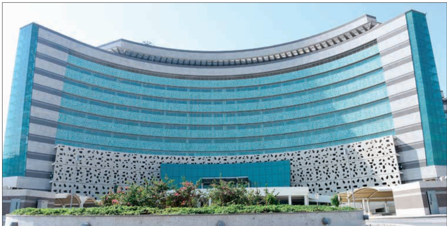
مستشفى جابر الاحمد

يتفضل صاحب السمو الأمير الشيخ صباح الأحمد فيشمل برعايته وحضوره حفل افتتاح مستشفى جابر الأحمد وذلك في تمام الساعة العاشرة والنصف من صباح اليوم الأربعاء.