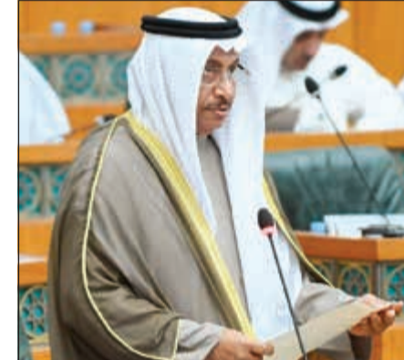
سمو رئيس مجلس الوزراء الشيخ جابر المبارك (هاني الشمري)