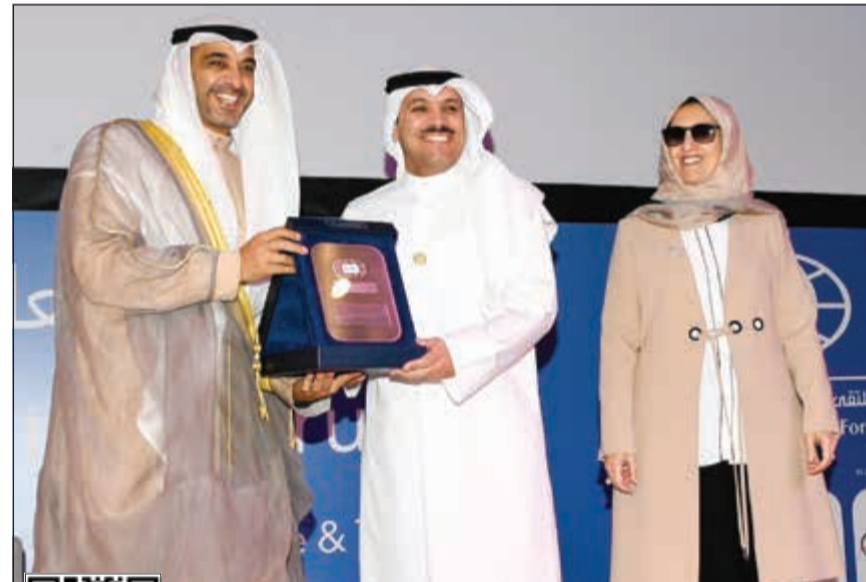
الشيخ محمد العدالله والشيخة عابدة سالم العلي يكرم د.محمد الهاشل (أحمد علي)

عبدالهادي العجمي افتتح ممثل صاحب السمو الأمير الشيخ صباح الأحمد، نائب وزير شؤون الديوان الأميري الشيخ محمد العدالله الملتقى العالمي للمعلوماتية 2018 صباح أمس. وأشاد العدالله بالرؤية السامية بتحويل الكويت إلى مركز إقليمي مالي وتجاري وتقني متقدم، كما أنه يشكل منصة واسعة لتكوين منظومة جديدة ذات فاعلية كبيرة في التغيير الاقتصادي. من جهته، قال محافظ بنك الكويت المركزي د.محمد الهاشل إن بنك الكويت المركزي يعمل على الدفع بصناعة التقنيات المالية وتوجيهها لهدف الكويت الاسمي وهو «استدامة الرفاه للجميع». • التفاصيل ص 5