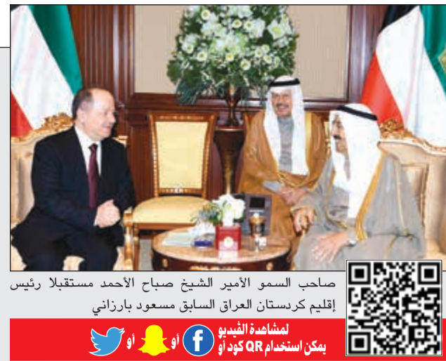
صاحب السمو الأمير الشيخ صباح الأحمد مستقبلاً رئيس إقليم كردستان العراق السابق مسعود بارزاني