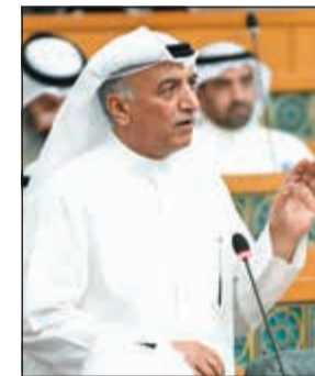
النائب شعيب المويزري

من جهته، اعتبر النائب د.عبدالكريم الكندري (معارضاً) طلب الإحالة التقافاً واضحاً على نصوص الدستور، موضحاً أنه لو كان المشرع يرغب في إعطاء صفة دستورية لإحالة الاستجواب إلى اللجنة التشريعية البرلمانية «لنص صراحة على ذلك».