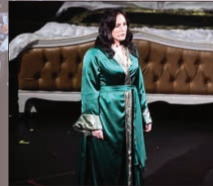
المطربة عبير نعمة