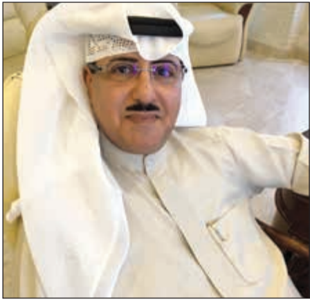
وكيل المساعد لشؤون الإذاعة الشيخ فهد المبارك