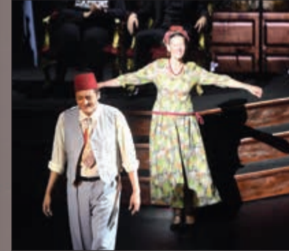
المطرب طارق بشير في بروقات الحفل (محمد هاشم)