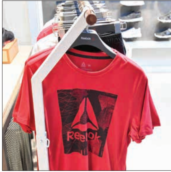
تشكيلة مميزة في معرض ريبوك