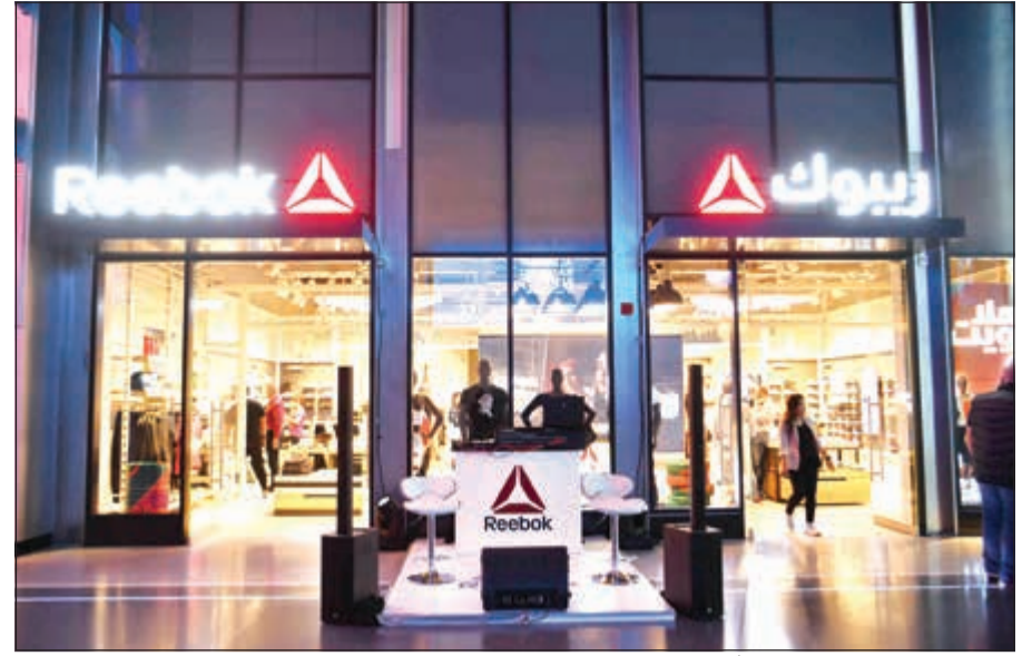
معرض ريبوك 3,0 FitHub في الأقيوز - المرحلة الرابعة - الكترا (قاسم باشا)