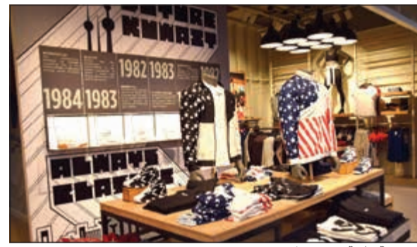
مجموعة رائعة من ريبوك

لخريف وشتاء 2018، ومجموعة من الألبسة والأحذية المخصصة لمختلف النشاطات الرياضية كالركض واليوغا والكرات فبت التدريب والرخص، بالإضافة إلى مجموعات «ريبوك كلاسيك» المستوحاة من الأزياء العصرية.