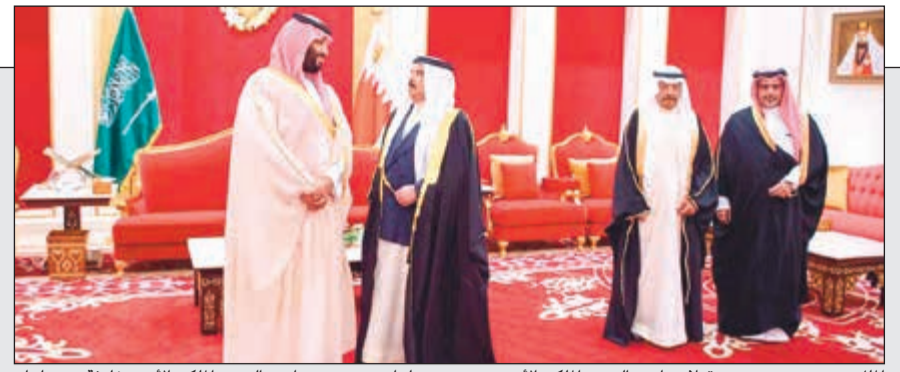
الملك حمد بن عيسى مستقبلاً صاحب السمو الملكي الأمير محمد بن سلمان بحضور صاحب السمو الملكي الأمير خليفة بن سلمان وصاحب السمو الملكي الأمير سلمان بن حمد آل خليفة

ملك البحرين مستقبلاً محمد بن سلمان في المنامة: