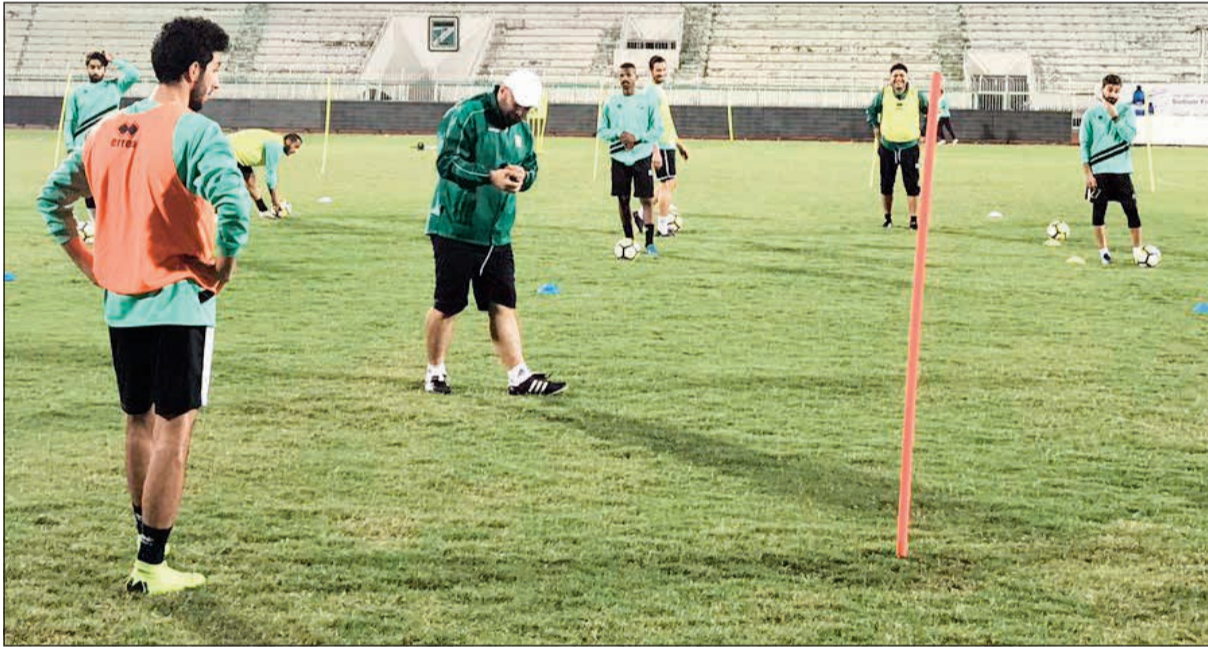
جانب من تدريبات الأخضر أمس

خاصة لدى الجهازين الفني والإداري والجماعي العربية والمتعطشة إلى فوز معنوي ومهم في هذا التوقيت من المسابقة.