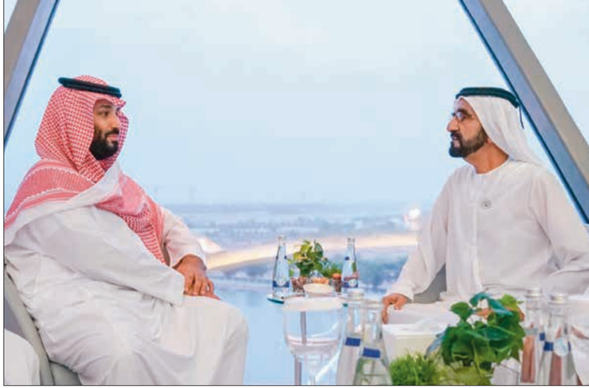
صاحب السمو الشيخ محمد بن راشد مستقبلا صاحب السمو الملكي الأمير محمد بن سلمان أمس

وأوضح وزير العدل البحريني أن نتائج الانتخابات النيابية في محافظة العاصمة (المنامة) أسفرت عن فوز أحد المرشحين بالدائرة الأولى فيها، فيما تجرى إعادة في الدوائر التسع الأخرى، وكذلك في محافظة «المحرق» حيث فاز أحد المرشحين بالدائرة الرابعة