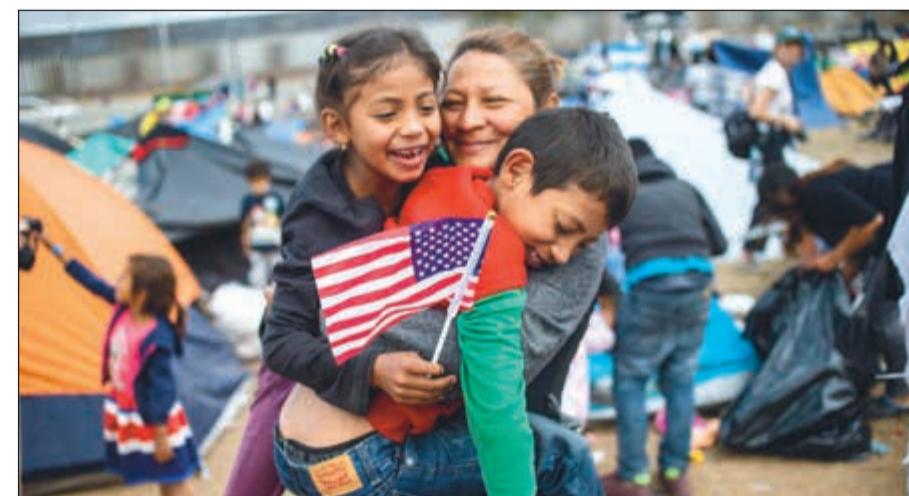
مهاجرون من أميركا الوسطى في مخيم تيخوانا قرب الحدود المكسيكية - الأميركية

وأضافت الصحيفة أنه بموجب القواعد الجديدة، لن يسمح لمقدم الطلب الذي رفض طلبه، باللجوء إلى المكسيك، لكنه سيبقى رهن الاحتجاز لدى الولايات المتحدة حتى يتم ترحيله فوراً إلى بلده الأم. كما تضمنت التصريحات مع نشر الرئيس الأميركي عبر «تويتر» تغريدة قال فيها أن «جميعهم (المهاجرين) سيقفون في المكسيك، كون الولايات المتحدة لا تسمح بدخول سوى المهاجرين الشرعيين»، فيما بدا أنه تأكيد لتقرير نشرته صحيفة «واشنطن بوست».