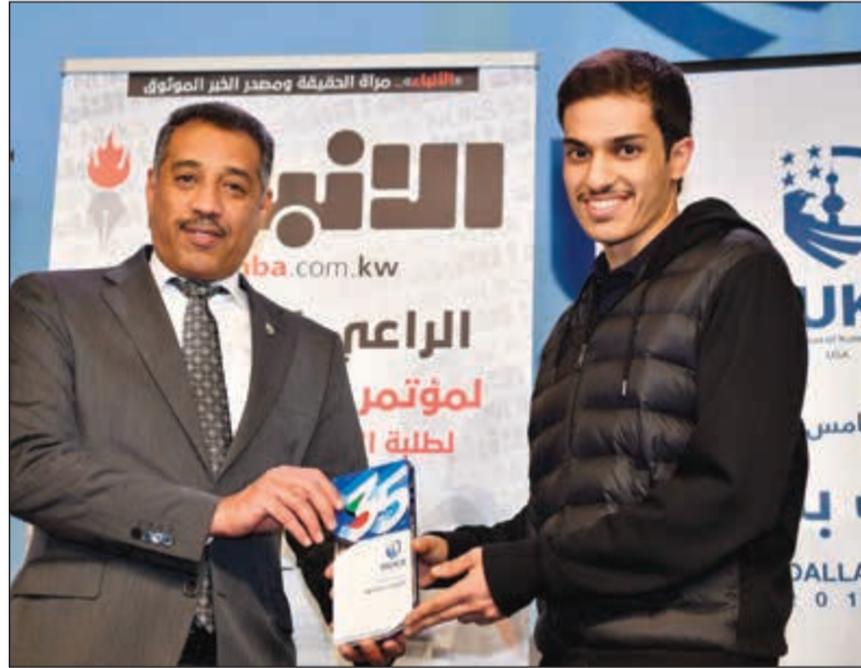
تكريم الهيئة العامة للاستثمار