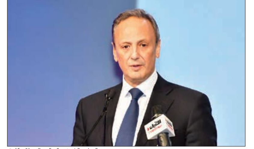
السفير الشيخ سالم العبدالله يلقي كلمته

المؤتمر الـ 35 لطلبة الكويت الدارسين في أميركا اختتم أعماله بتكريم الرعاية