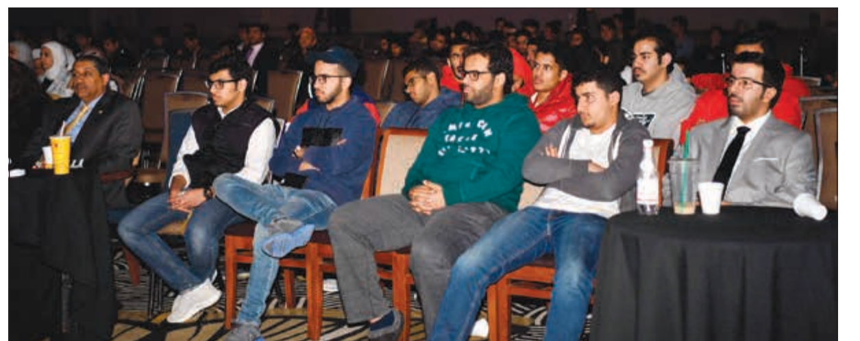
متابعين من الحضور

واستشهدت بالمزارع الكويتي ناصر العازمي وحديثه عن الغاية الوطنية وموضوع التشجير، ورغم صعوبة التحدي استطاع من خلال تجربته أن يحظى بالثقة. وأشادت د.الرفاعي بأمبركا قائلة: ما زالت أميركا الدولة النموذج والقائد، ووجودكم كطلبة فيها فرصة لتعلم التجربة والشغف والنشاط والحركة وليس فقط نيل الشهادة، ومن ناحيتها، تحدثت د.شبيخة الجاسم عن الحرية كأساس للتغيير، وتطرق إلى ما شهد معرض الكتاب من منع أكثر من 4500 كتاب في السنوات الأخيرة، قائلة: لست من هواة قراءة الروايات عموما، ولكن من الأعمال المنوعة «الإخوة كارامازوف»