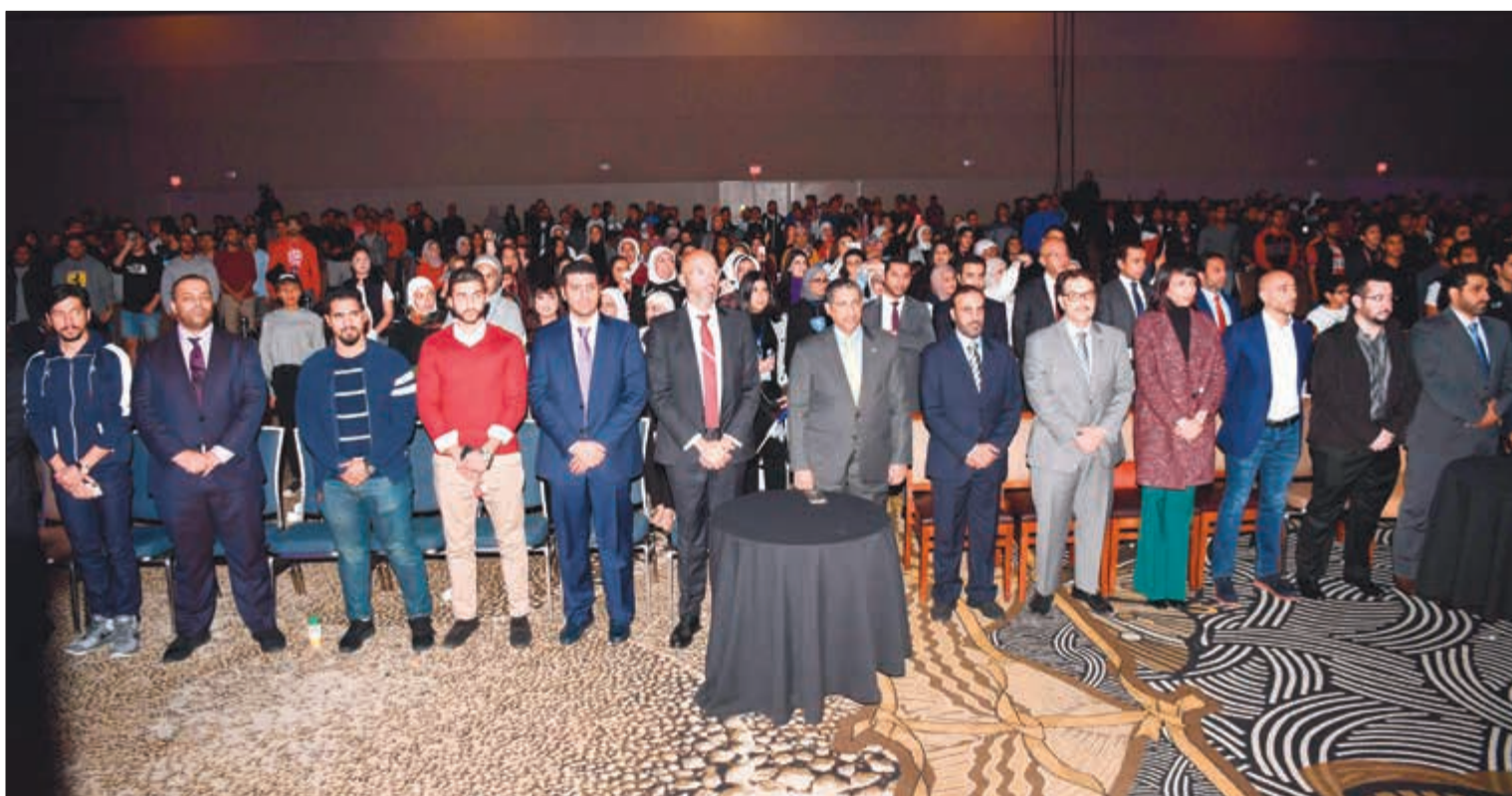
جانب من الحضور في الحفل الختامي لمؤتمر اتحاد طلبة أميركا