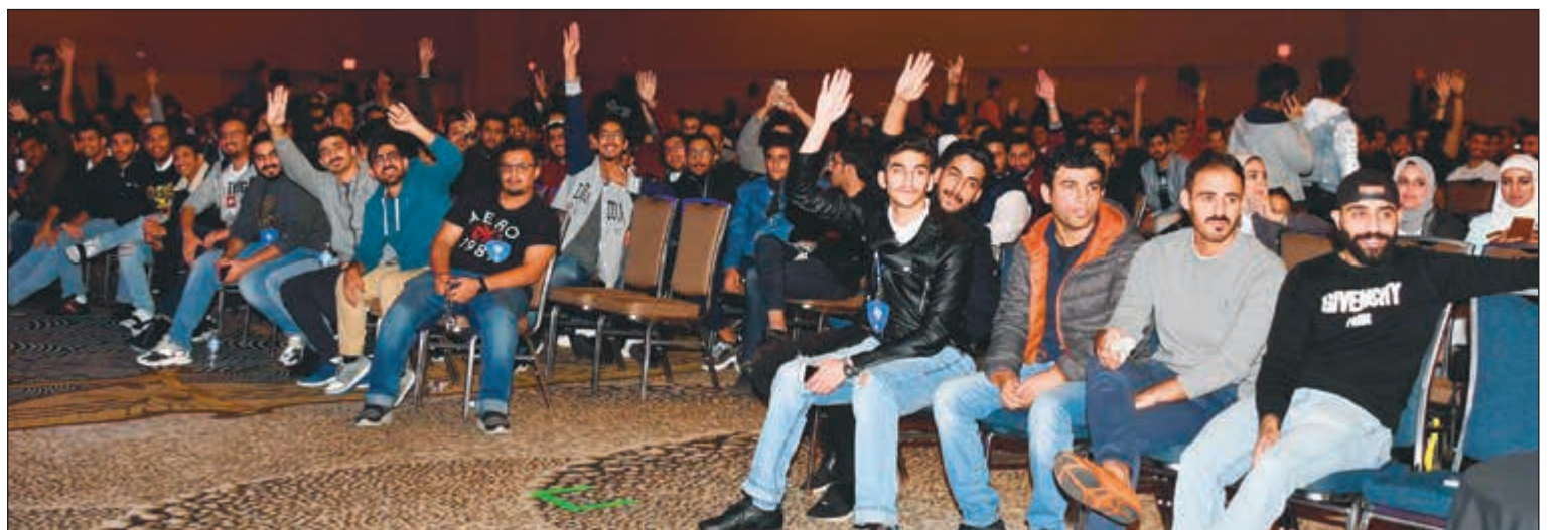
تفاعل من الطلبة مع مسابقات «الأنباء»