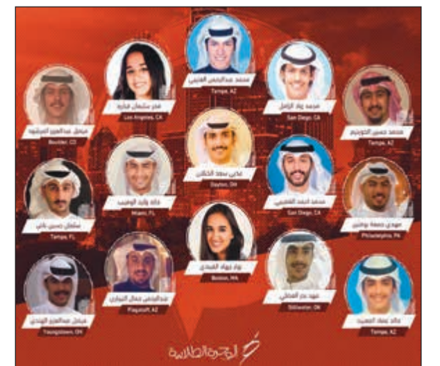
أعضاء وفد المؤتمر