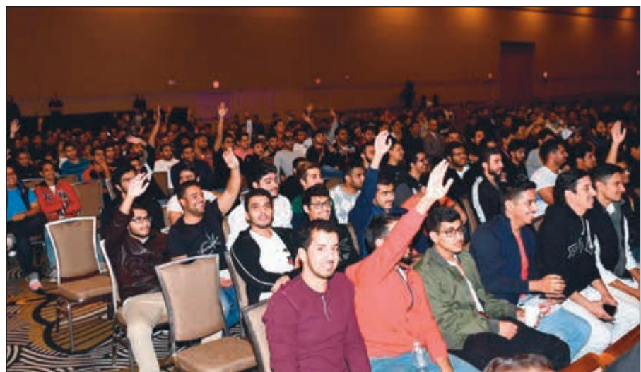
من الطلبة المشاركين