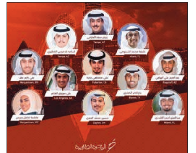
أعضاء الهيئة الإدارية

واصل انصار قائمة الوحدة الطلابية احتفالهم بفوزهم المستحق على منافستهم «المستقبل الطلابي». حيث احتفل الطلبة بفوزهم في اجواء احتفالية تبداً فيها الطلبة التهانى بالفوز وشكروا كل من دعمهم وساندهم حتى حققوا الفوز.