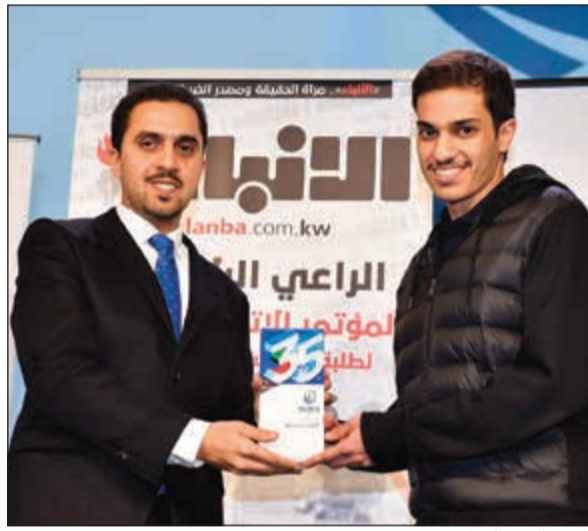
تكريم البنك الدولي