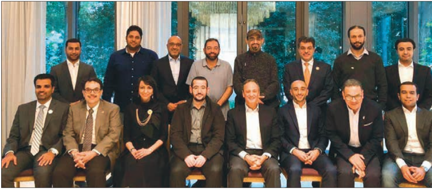
السفير الشيخ سالم العبد الله متوسطا القنصل فيصل الهولي و أعضاء اللجنة الوزارية ورئيس التحرير الزميل يوسف خالد المرزوق والإعلامي ثامر الدخيل