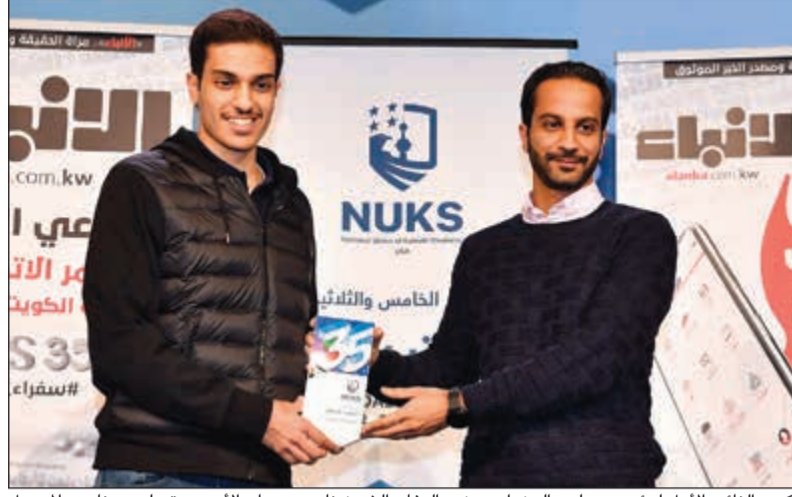
تكريم النائب الأول لرئيس مجلس الوزراء ووزير الدفاع الشيخ ناصر صباح الأحمد يتسلمه د.ناصر المجيبيل