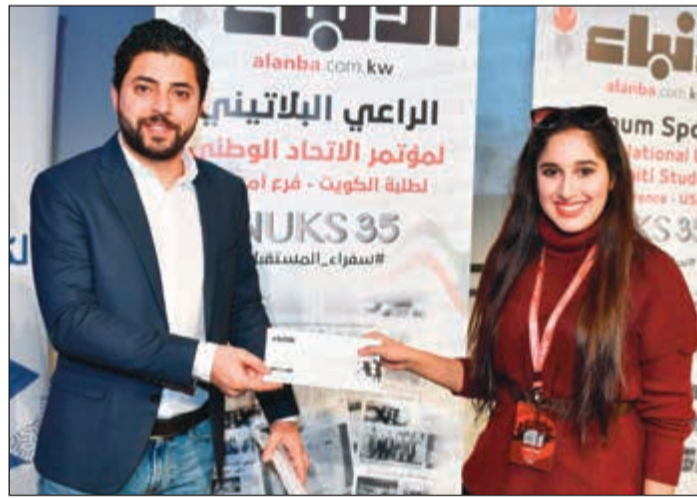
أحدى الطالبات الفائزات