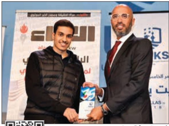
تكريم مؤسسة البترول