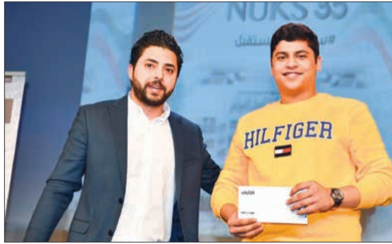
طالب يتسلم جائزته