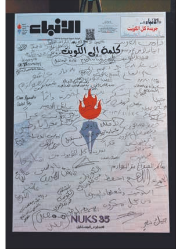
الحضور حرصوا على التوقيع على لوحة «الأنباء»