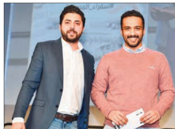
جائزة لأحد الفائزين