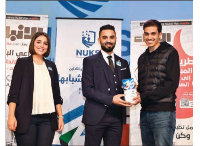
تكريم وزارة الشباب