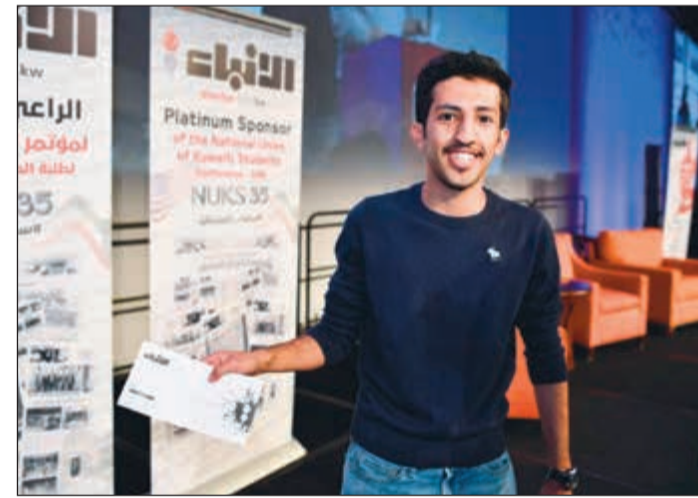
فرحة الفوز بجائزته