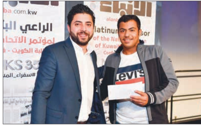
جائزة لأحد الطلبة