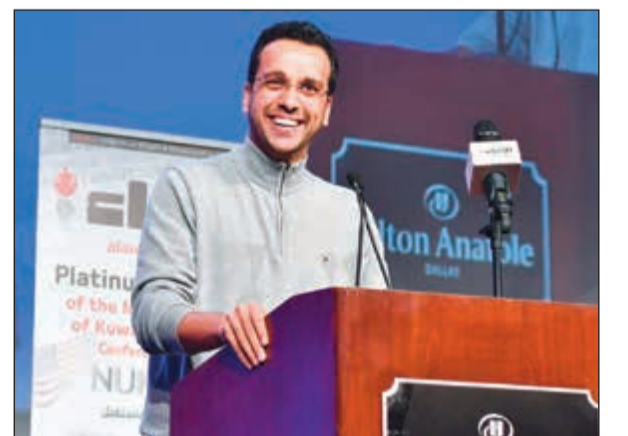
الإعلامي محمد السداني يقدم فرحة جوائز «الأنباء»