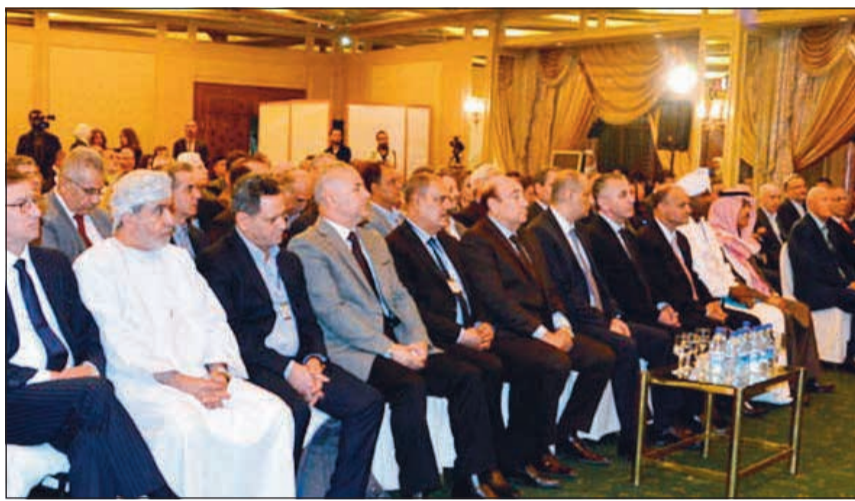
أعضاء اتحاد الصحفيين العرب خلال اجتماعهم في دمشق