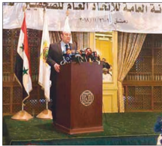
أحد المتحدثين في الاجتماع

«سورية موجودة الآن بإعادة انتخاب الياس مراد مرة أخرى للأمانة العامة لاتحاد الصحفيين العرب في الدورة الأخيرة التي عقدت في تونس، وهذا كان مؤشرا لعودة هذا التقارب بين اتحاد الصحفيين العرب واتحاد الصحفيين السوري وارتقائه الى مستويات جديدة».