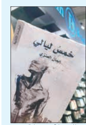
..وغلاف رواية «خمس ليالي»