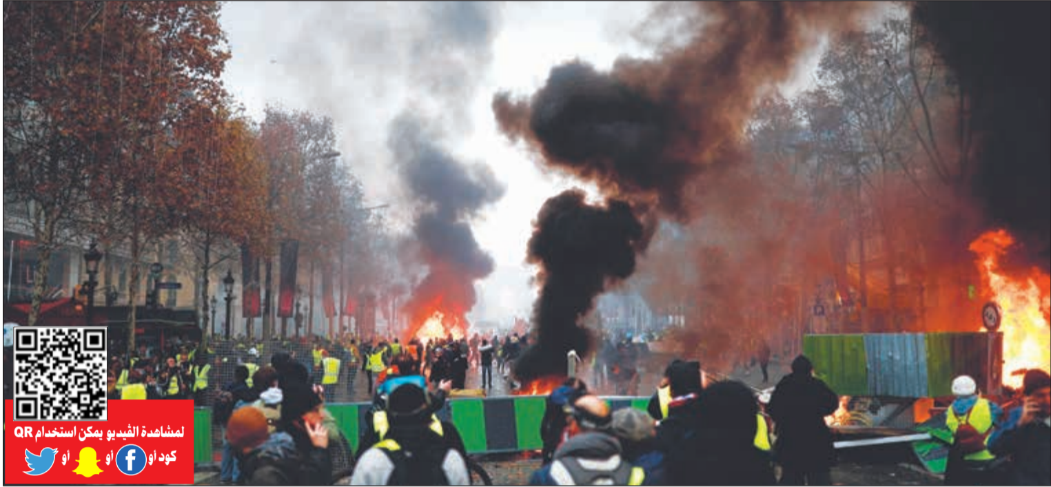
المتحجون يقفون أمام حاجز في شارع الشانزليزيه في باريس

باريس - كونا: أهابت سفارة الكويت في فرنسا بالمواطنين الكويتيين في المدن الفرنسية التي أخذ الحيطه والحذر وعدم الاقتراب من أماكن المظاهرات العمالية المستمرة منذ صباح اليوم. ونصحت السفارة الكويتية في بيان أمس تلقتة «كونا» المواطنين بالبقاء في مقار السكن وعدم مغادرتها إلا لحالات الضرورة مع الالتزام بتعليمات وإرشادات السلطات المحلية بهذا الخصوص. ودعت إلى ضرورة التواصل مع السفارة في الحالات الطارئة على الأرقام الآتية: 0033147235425 - 0033670673834