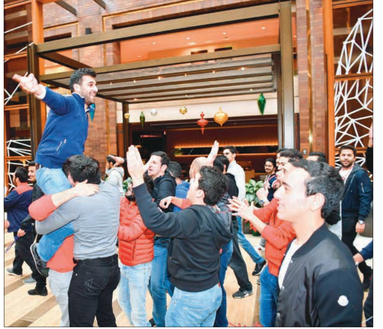
فرحة وحدوية كبيرة