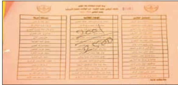
بطاقة اقتراع وفد المؤتمر