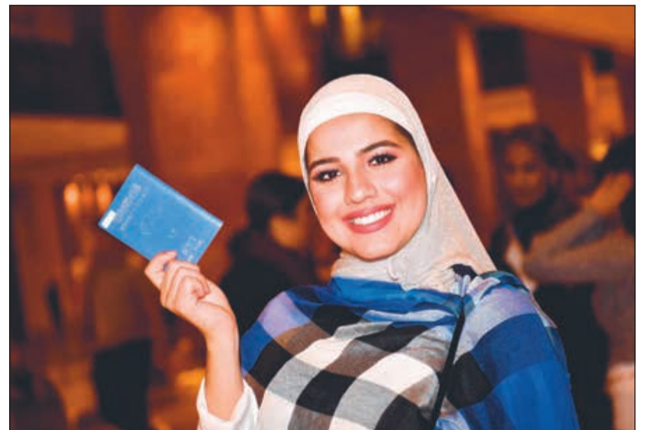
إحدى الطالبات واستعداد للمشاركة في عملية الاقتراع