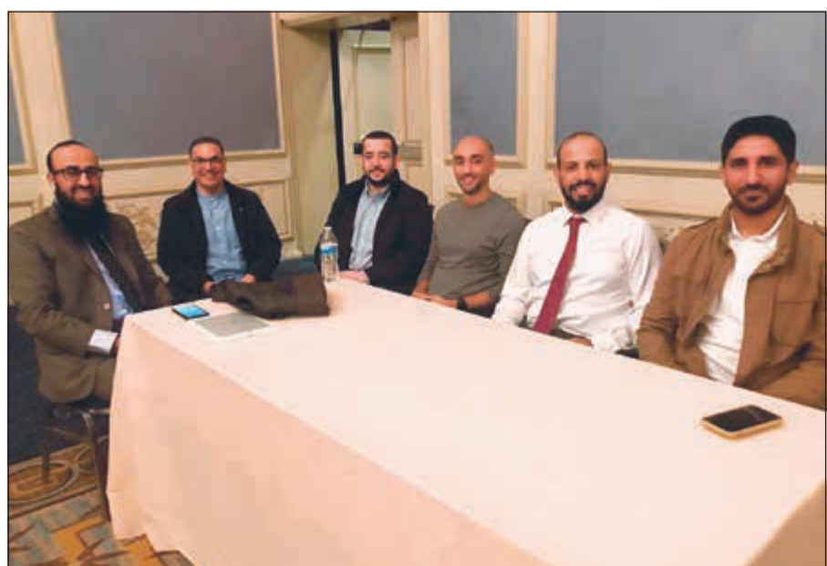
عدد من المشاركين في متابعة عملية الفرز