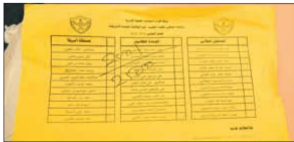
ورقة اقتراع الهيئة الإدارية