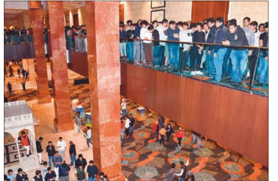
جانبا من الإقبال الطلابي الكبير على المشاركة في المؤتمر الطلابي