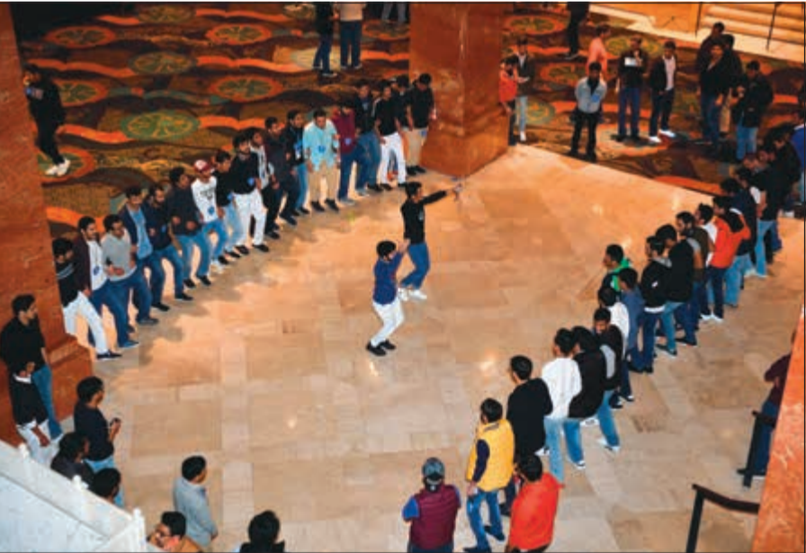
فرحة بالأجواء الديمقراطية