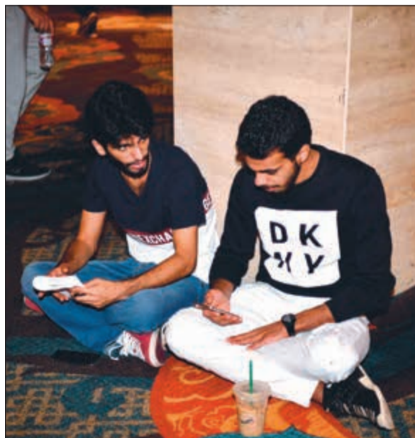
استراحة بين أنشطة المؤتمر