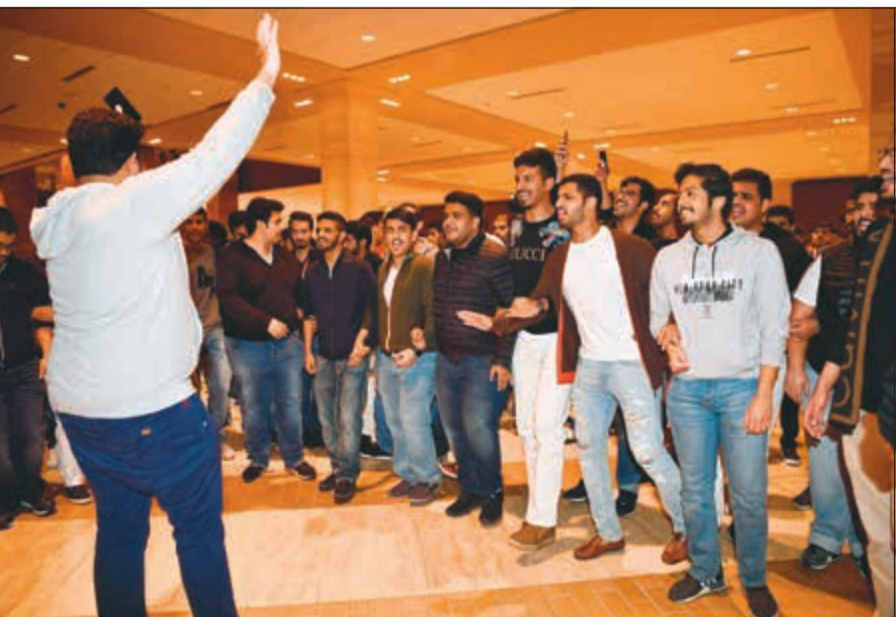
«شيلات» طلابية على هامش العملية الانتخابية