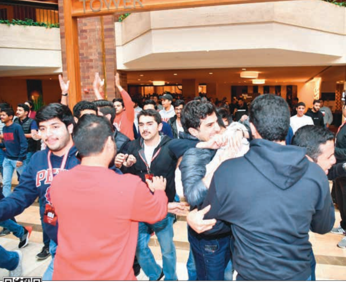
تبادل التهانني بالفوز