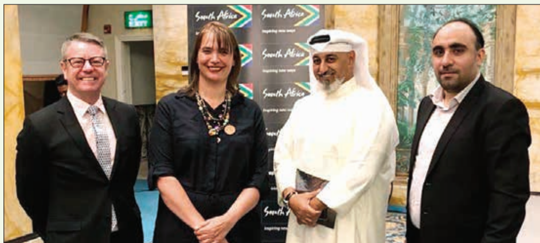
جانب من العرض المتنقل لشركات السياحة في جنوب أفريقيا