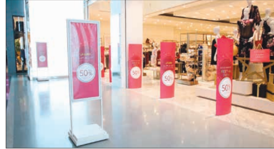
تخفيضات حصرية لدى أغلب المحلات والمتاجر تزامنا مع «الجمعة البيضاء»