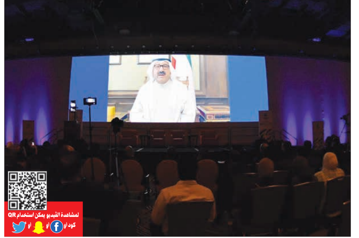
النائب الأول لرئيس مجلس الوزراء ووزير الدفاع الشيخ ناصر صباح الاحمد يلقي كلمة متلفزة في افتتاح المؤتمر