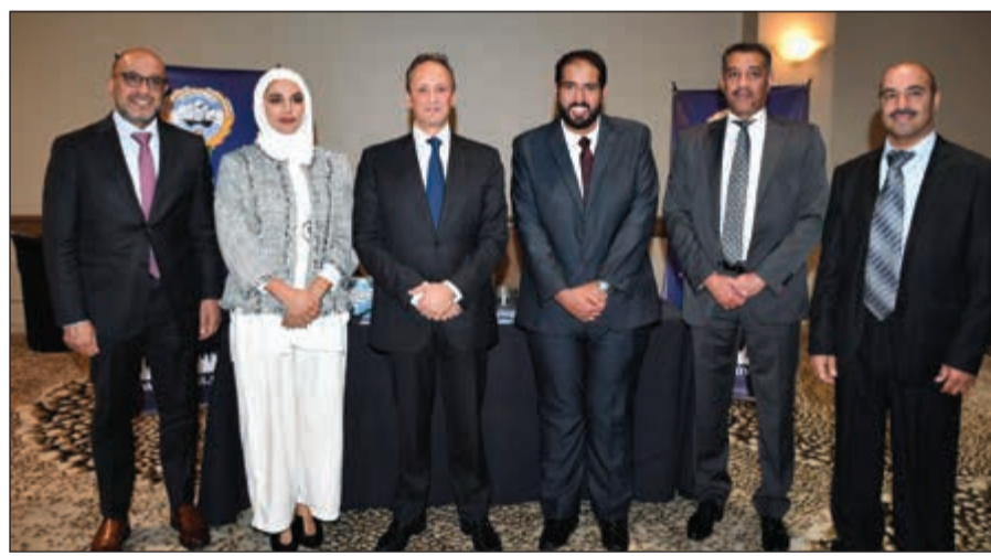
جناح الهيئة العامة للاستثمار