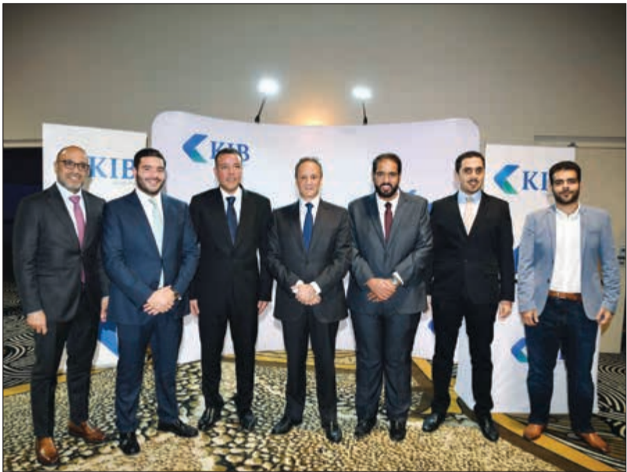
السفير الشيخ سالم العبد الله والقنصل العام فيصل الهولي وجمال البراك ونواف ناجيا وفهد السرحان في جناح البنك الدولي