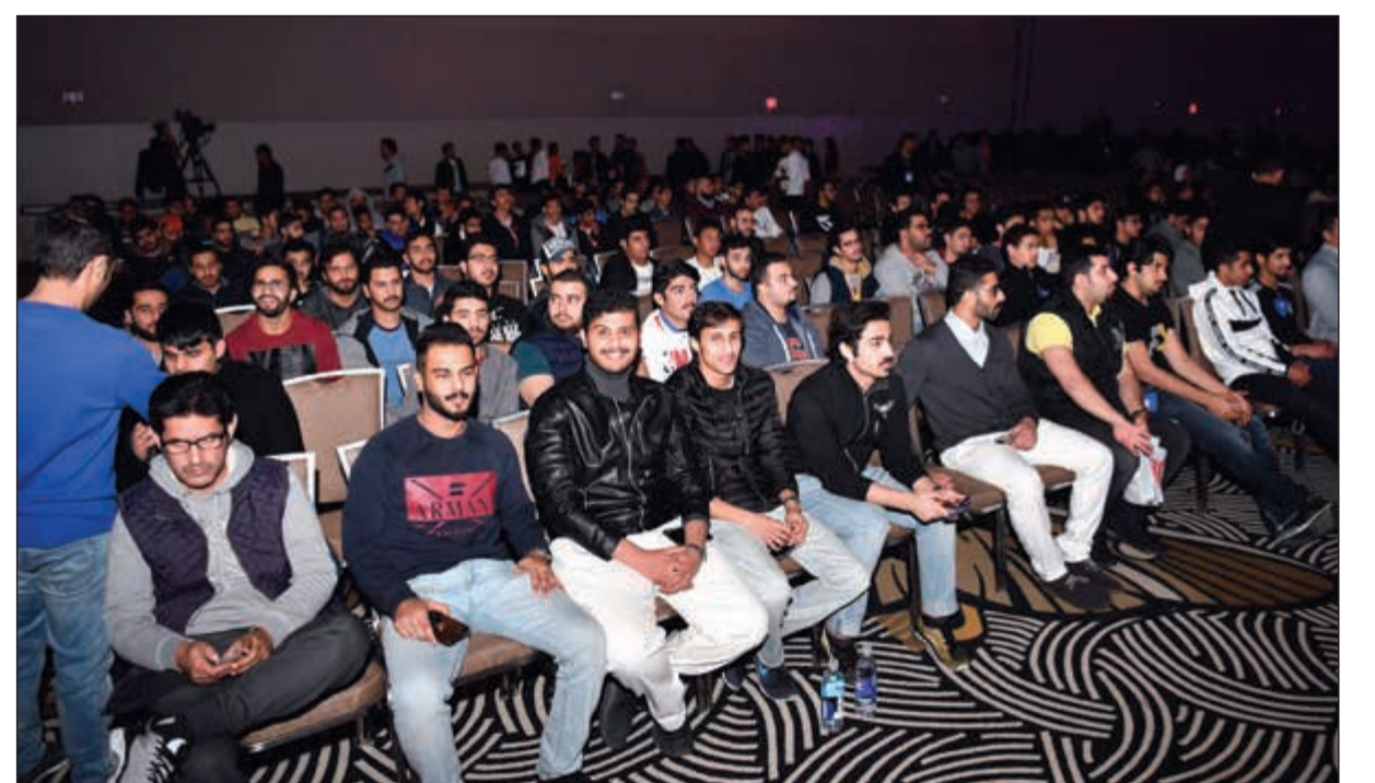
متابعة لأعمال المؤتمر