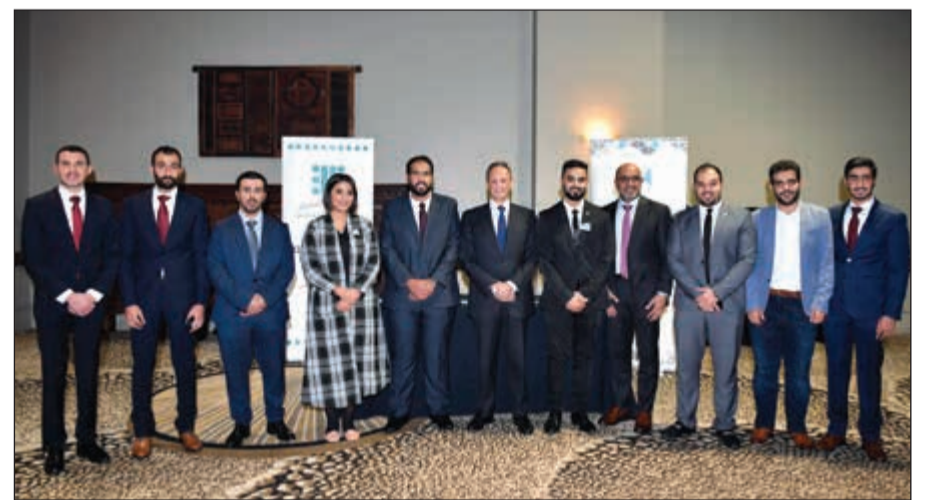
السفير الشيخ سالم العبد الله والقنصل العام فيصل الهولي و طلال العنزي في جناح وزارة الشباب

مضيفا: نعدكم دائما بالأفضل ونتمنى أن تكونوا معنا في الأعوام القادمة. ووجه العنزي الشكر للطلبة على فقتهم، معددا الإنجازات والمكاسب الطلابية التي حققها الاتحاد في عهد الهيئة الإدارية الحالية.