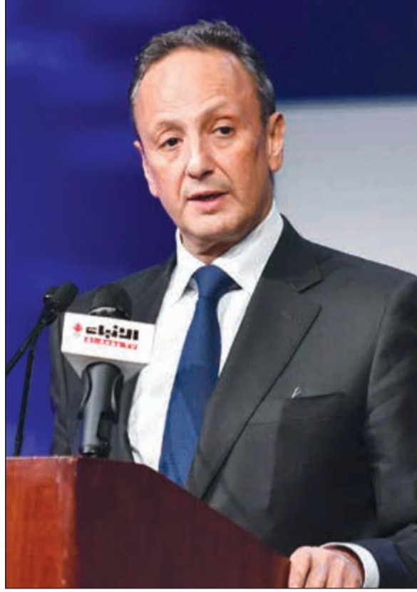
السفير الشيخ سالم العبد الله يلقي كلمته