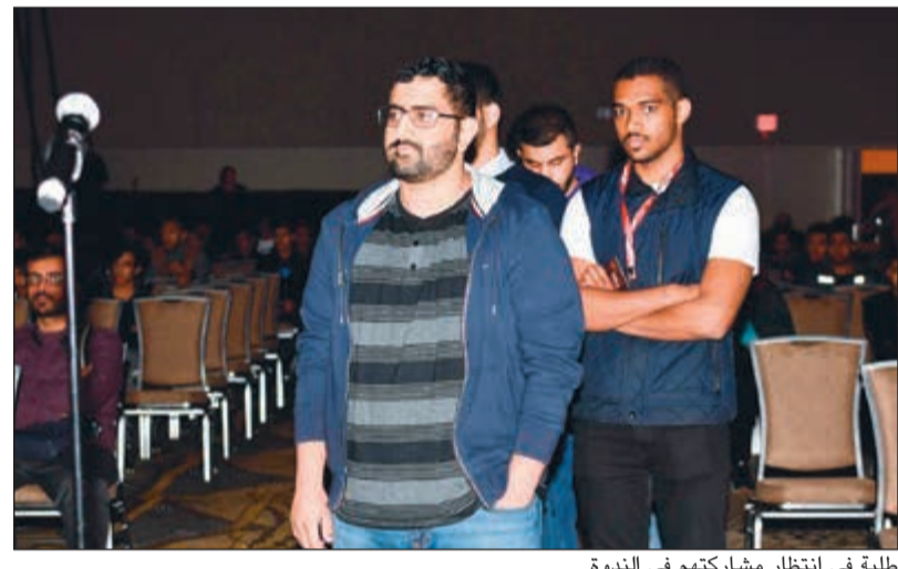
طلبة في انتظار مشاركتهم في الندوة

جانب الاستثمارات من خلال الصندوق السيادي. وشرح د.الجبيل أن الميزانية الحالية للسداد تقدر بنحو 21 مليار دينار، لكن 15 مليارات منها تذهب إلى الرواتب (11 ملياراً) والديون (4 مليارات) ولا يتبقى للإنفاق الرأسمالي