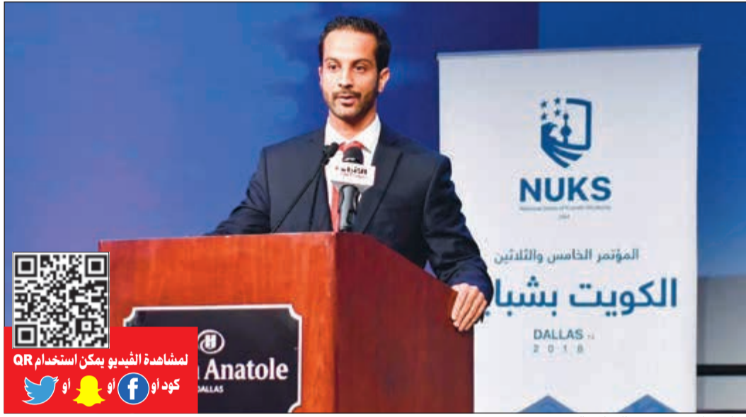
د.ناصر الجبيل متحدثاً خلال الندوة

■ للرؤية 4 محاور: تعزيز الاقتصاد المعرفي والدولة الذكية - معالجة خلل الميزانية - ترشيد الإدارة الحكومية وتطوير العنصر البشري