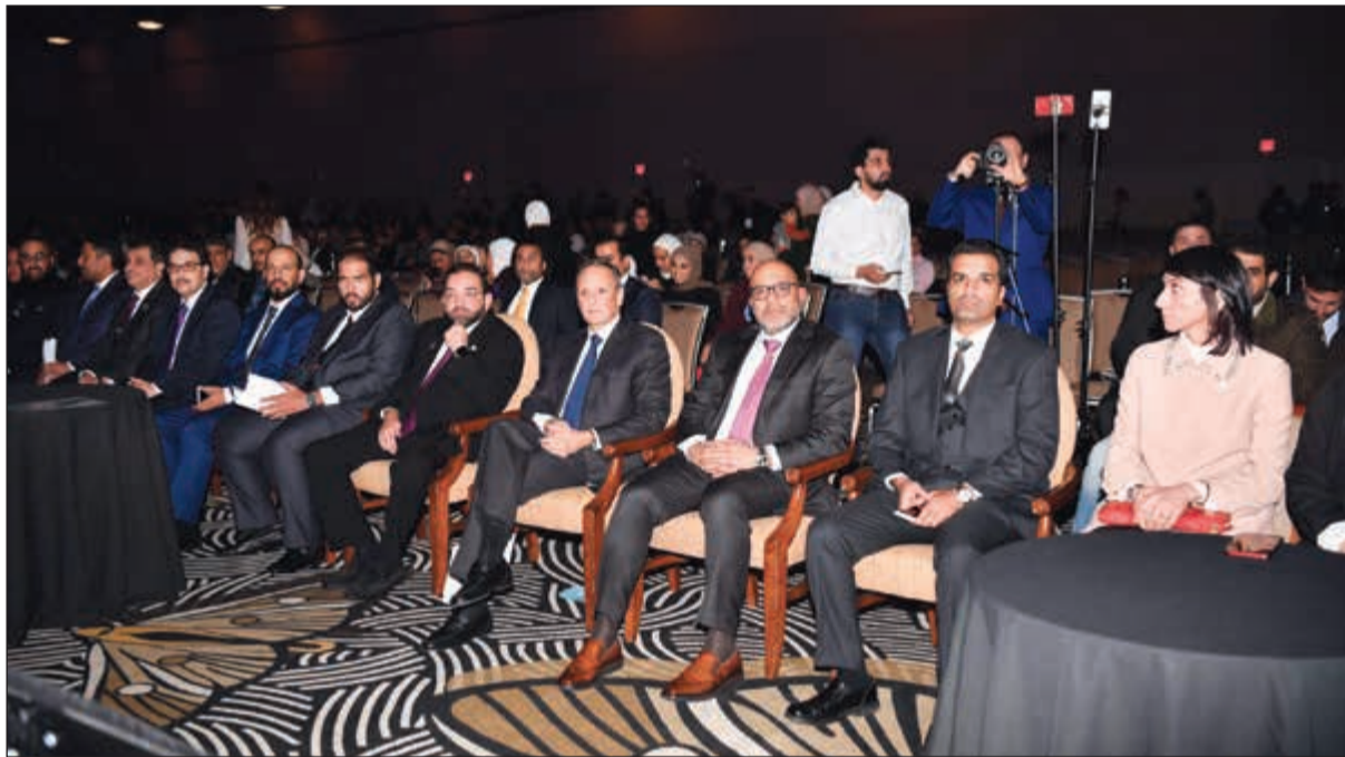
السفير الشيخ سالم العبد الله والقنصل فيصل الهولي ورئيس التحرير الزميل يوسف خالد المرزوق في مقدمة الحضور