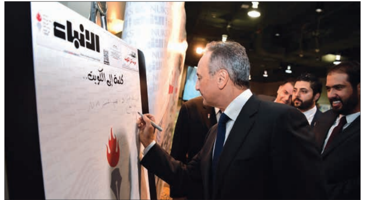
السفير الشيخ سالم العبدالله يسجل كلمة في جناح «الأنباء»

الأمير وسمو ولي العهد. ودعا السفير العبدالله الطلبة المتواجدين في الولايات المتحدة الصديقة الى التركيز على تحصيلهم العلمي والالتزام بالقوانين والأنشطة والتقدير بجميع اللوائح التنظيمية والأكاديمية. وأعرب عن سعادته بهذا التجمع، مشددا على أنه يعتبره الأقرب الى قلبه، كما توجه بالتعزية الى أسرة الطالب الكويتي الفقيد السدي واقته المنية في حادث سير اليم في يوم المؤتمر، متمنيا لرفاهة الشفاء العاجل.