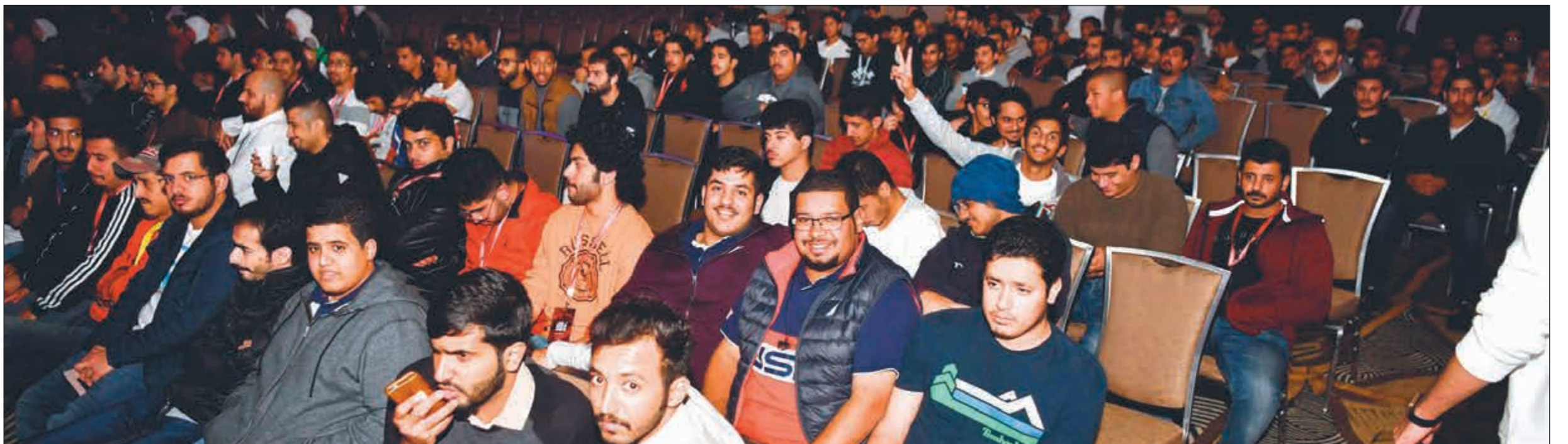
العديد من الطلبة حرصوا على المشاركة في حفل الافتتاح

هذا العام في ظل المنافسة المعهودة بين قائمتي المستقبل والوحدة، يتميز المؤتمر بمجموعة من الندوات المميزة أبرزها الندوة الاقتصادية التي تتناول تطوير الجزر، والندوة الفكرية التي تشهد مناظرة بين