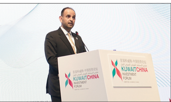
د.نايف الحجرف مفتتحاً منتدى الاستثمار الكويتي - الصيني الأول

«نهدف إلى رفع تصنيف الكويت للمرتبة الثالثة عالمياً» الحجرف: استثمار أكثر من 100 مليار دولار في البرامج التنموية حتى عام 2035