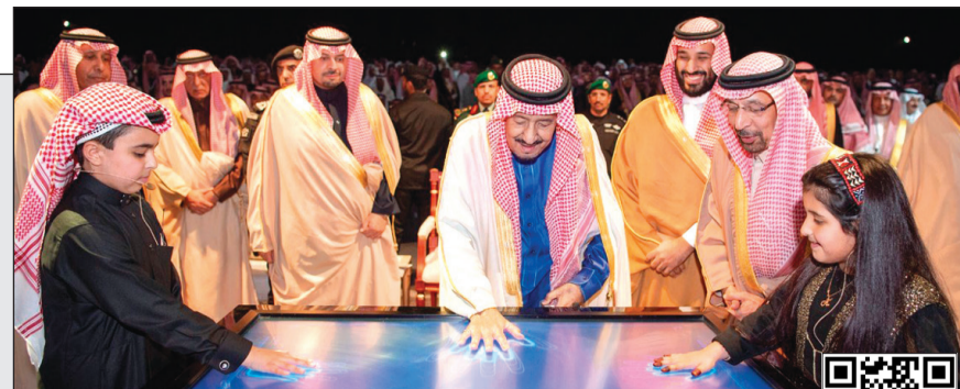
خادم الحرمين الشريفين يبدن المرحلة الأولى من «وعد الشمال» ويضع حجر الأساس للمرحلة الثانية