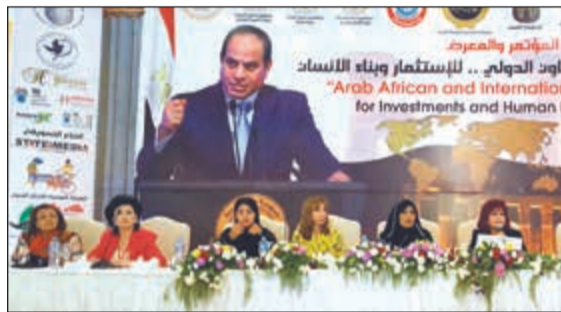
جانب من الجلسة الختامية للمؤتمر

مزايا الاستثمار في المحافظة من توافر الأرض بالمجان وإعفاء ضريبي لمدة 5 سنوات، كما قدم الفرص الاستثمارية المتاحة بالمحافظة منها في مجال مواد البناء والصناعات الكهربية والغذائية إلى جانب المشروعات السياحية. وأعلنت د.هدى يسى رئيس الاقتصاد ورئيس المؤتمر، أنه جاءت في مقدمة توصيات المؤتمر اتفاق المشاركين من ممثلي الدول العربية على رفع برقية شكر للرئيس عبدالفتاح السيسي.