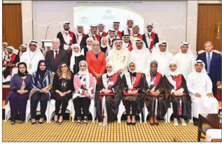
الحماد مع الخريجين

بشكل أساسي بتدريب وتوظيف الخريجين الكويتيين من حملة المؤهلات الجامعية والدبلوم، ما هو إلا أحد المشاريع المهمة التي يدعمها وينفذها بنك بوبيان، والتي تساهم في تدريب وتأهيل الكوادر الكويتية وتوظيف الخريجين منهم في القطاع الخاص.