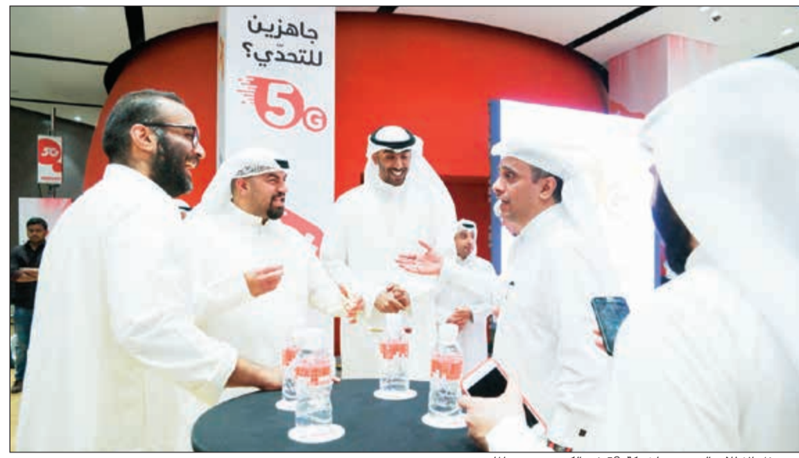
من حفل الإطلاق التجريبي لشبكة 5G في الكويت يونيو الماضي

الطيف 3,5 غيغاهيرتز. وبذلك تكون شبكة 5G من Ooredoo قطر هي أول شبكة من الجيل الخامس 5G تتوافر بشكل تجاري في العالم وهو سبق تكنولوجي مهم في قطاع الاتصالات على مستوى العالم.