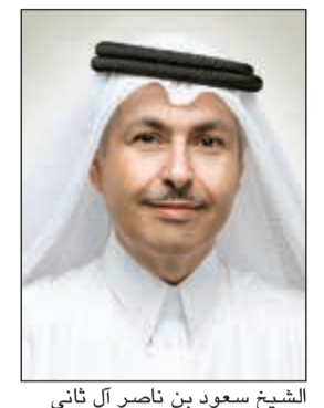
الشيخ سعود بن ناصر آل ثاني

تواصل مجموعة Ooredoo تنفيذ الأعمال التي تهدف إلى تعزيز شبكات مختلف شركاتها الموجودة حول العالم، وذلك كجزء من استثماراتها الكبيرة في بناء شبكات تتميز بأرقى المواصفات العالمية في المناطق التي تتواجد فيها، الأمر الذي تقف الشركة بانه سيتيح الفرصة لأفراد المجتمعات للاستفادة من العديد من فرص العمل والتعليم والترفيه أينما كانوا. وتأتي أعمال تطوير الشبكة في إطار برنامج تطوير الشبكات الذي يتم تنفيذه على مستوى المجموعة انطلاقاً من استراتيجية الرقمنة لتعزيز التجربة الرقمية لعملائها. وكونها أول شركة في العالم تطلق شبكة 5G على نطاق تجاري في قطر، بالإضافة إلى استثماراتها الواسعة في تعزيز شبكاتنا في المناطق التي تتواجد فيها، تتصدر Ooredoo اليوم قطاع التكنولوجيا وتحقق العديد من الإنجازات على مختلف الأصعدة.