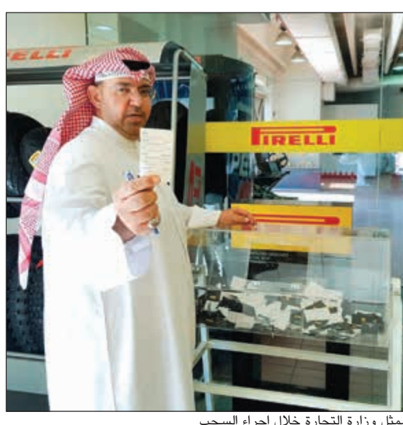
ممثل وزارة التجارة خلال إجراء السحب

الإطارات، الرائدة في الامتياز، وذات التقنيات والمحتوى التكنولوجي العالي، تأسست بيريلي عام 1872، ولديها اليوم 19 مصنع إطارات صناعي في أربع قارات حيث تعمل من خلال شبكة مبيعات واسعة الانتشار في أكثر من 160 دولة حول العالم. تتميز بيريلي بتقاليدها الصناعية الطويلة، والتي كانت دائما مع القدرة على الابتكار وجودة المنتج وقوة العلامة التجارية. وهي القوة التي تم دعمها منذ عام 2002 أيضاً من قبل مشروع التصميم الصناعي من PZero، والتي تم الاعتراف بها اليوم من قبل الفورمولا 1، حيث تعتبر بيريلي هي المورد الحصري للسباق منذ 2011.