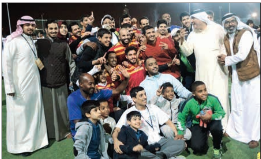
فكرة فريق العريف بالحصول على كأس البطولة