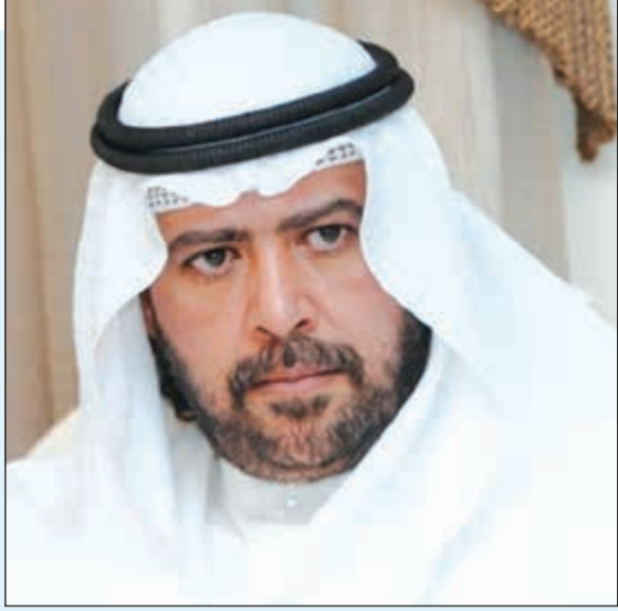
الشيخ أحمد الفهد

جلسة استماع لجنة الأخلاق الأولمبية، كما أنه على استعداد بل وراغب في حضور جلسة الاستماع هذه في أي وقت يتم اتخاذ قرار بذلك، كما للشيخ كل الثقة في المحاكم السويسرية وبعمليات لجنة الأخلاق الأولمبية الدولية النزاهة، وبأنه بريء من كل ما يقال عنه».