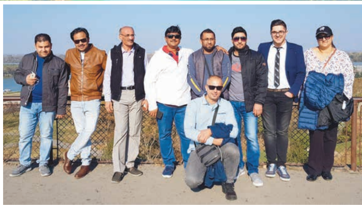
وفد شركات السياحة الكويتية

سوبوتيتسا هي خامس أكبر مدينة في البلاد وهي واحدة من أفضل الأماكن للزيارة وواحدة من أهم وجهات السياحة في صربيا وتتميز بتاريخها العريق فهي مدينة يعود تاريخها الى الألف الرابع قبل الميلاد، وتضم المدينة العديد من اماكن الجذب السياحية كما انها تشتهر بأسواقها، ولديها أعلى عدد من السكان الكاثوليك وتضم معظم مباني الفن الحديث أكثر من أي مكان آخر في البلاد كما انها تحتوي على عدد كبير من المباني القديمة، فهذه المدينة سبقت العصور الوسطى بقرون والدليل على ذلك المباني القديمة والعتيقة الموجودة بها مثل كنيسة القديسة تريزيا أقبالا التي بنيت في العام 1797، من الأسباب الأخرى التي تجعل المدينة مميزة هي المقاهي الموجودة حول الساحة الرئيسية والنافورة الزرقاء التي هي مكان جيد للاسترخاء وأيضا أكبر سوق للسلع المستعملة في أوروبا.