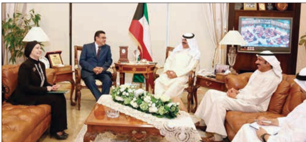
نائب وزير الخارجية خالد الجارالله أثناء اجتماعه مع السفير المصري طارق القوني

اجتمع نائب وزير الخارجية خالد الجارالله مع وفد من أعضاء الكونغرس الأميركي الذي يزور البلاد وتم خلال اللقاء استعراض مسيرة الشراكة الاستراتيجية بين البلدين الصديقين، إضافة إلى تطورات الأوضاع على الساحتين الإقليمية والدولية. وقد أشاد أعضاء الكونغرس بالدور المهم والكبير الذي تلعبه الكويت عبر سياستها الخارجية المتوازنة الداعمة لأمن واستقرار المنطقة، مؤكداً أهمية الشراكة الاستراتيجية بين البلدين الصديقين. حضر اللقاء مساعد وزير الخارجية لشؤون مكتب نائب الوزير السفير أيهم العمر ومساعد وزير الخارجية لشؤون الأميركيين الوزير المفوض ريم الخالد وسفير الولايات المتحدة الأميركية لدى الكويت لورانس سيفرمان.