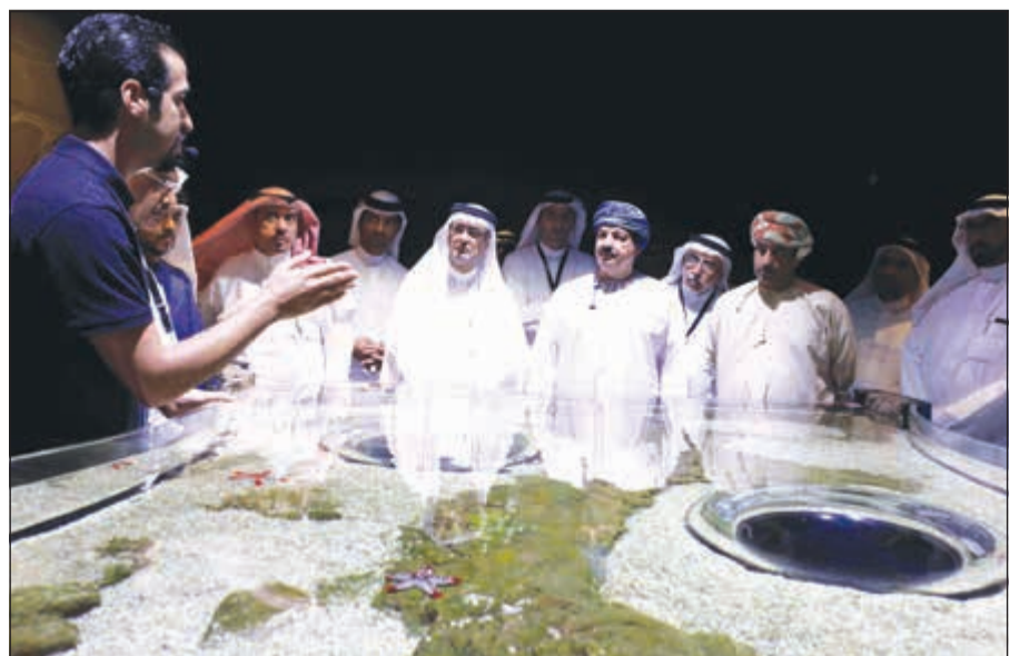
جولة في أحد الأقسام