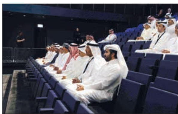
متابعة لإحدى الفترات

في الكويت، وقد حاز بفضل تصميمه وعروضه الفريدة الجائزة المعمارية العالمية ABB Leaf Award لعام 2017. كما تركز الرؤية التي يعتمدها المركز على تسهيل التبادل المعرفي وتطوير مهارات التفكير النقدي والإبداعي والتحليلي، الأمر الذي يجلي في معارضه راقية المعايير وبرامجه التثقيفية العامة الموجهة للمجتمع الكويتي بفئاته كافة.