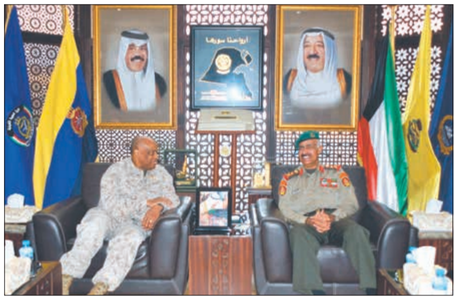
رئيس الأركان مستقبلاً الفريق فانسنت ستورتات

استقبل الخضر المحقق العسكري لجمهورية فرنسا الصديقة لدى البلاد العقيد الركن طيار باتريك بيكييه، حيث تم خلال اللقاء تبادل الأحاديث الودية، ومناقشة الأمور ذات الاهتمام المشترك وسبل تعزيزها وتطويرها بين البلدين الصديقين.