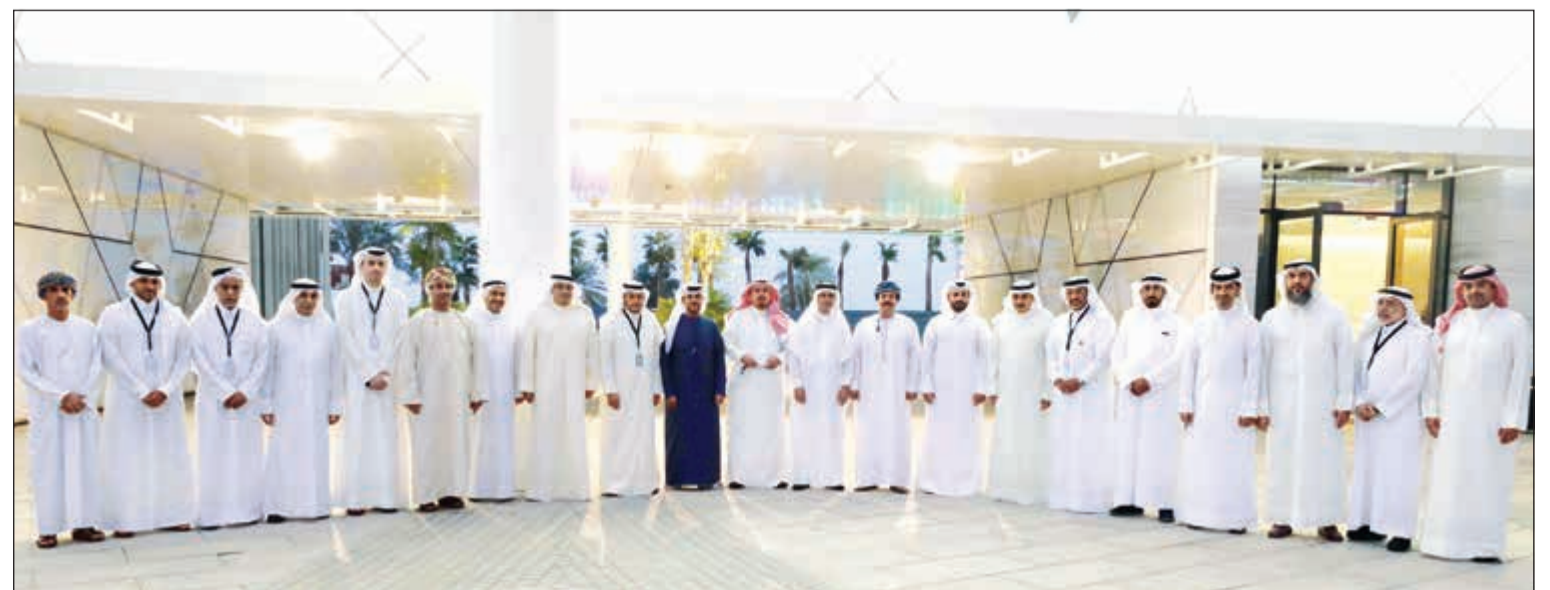
لقطة تذكارية خلال الزيارة

استضاف مركز الشيخ عبدالله السالم الثقافي عدداً من وكلاء وزراء البلديات في دول مجلس التعاون الخليجي، وذلك ضمن زيارة تعريفية بأحدث المعالم الثقافية في الكويت. ورحبت إدارة المركز والعاملون فيه بالمهندس أحمد المنقوشي، مدير عام بلدية الكويت، وشخصيات أخرى بارزة من داخل الدولة، وكلاء وزراء البلديات لدولة