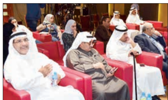
جانب من الحضور في ندوة «الكتابات والنقوش على أرض الكويت»

واستعرض الدويش مجموعة من الصور لرسومات صخرية عثر عليها في الكويت ومنها صخرة أميرة شمال جون الكويت في منطقة غنية بطبيعة ومصاير المياه وتقع على طريق القوافل القديم وتتوافر فيها آبار المياه. وأوضح أنه تم العثور على أبقار صابونية من جزيرة جيمكا لصف من الثيران ومجموعة من المتعبدين وهو تحت قبضه من الثيران الرافدين فضلا عن اكتشافات أثرية لأختام تمثل العديد من العصور التاريخية.