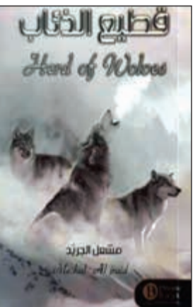
غلاف رواية قطيع الذئاب