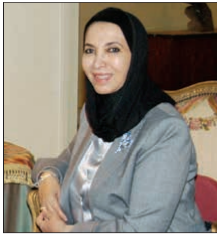
الشيخة د.سعاد الصباح

عن الشيخ عبدالله بن صباح الصباح الحاكم الخامس للكويت، وتوضح صفحات الكتاب العلاقة الوثيقة التي جمعت بين أهل الكويت حكاما ومحكومين وأن حكم الكويت اتسم بروح التشاور والتسامح وهو ما أعطى لتاريخها نكهة خاصة تميزت بها عن الآخرين. وسلطت الشبيخة د.سعاد الصباح الضوء في المقدمة على موضوع الكتاب أي شخصية وتجربة الشيخ عبدالله بن صباح الصباح الذي عرف باسم عبدالله الثاني وأنه أحد الشيوخ الذين استمر حكمهم مدة طويلة أسوة بالحكام الثلاثة الأوائل، وهم جده الأكبر الشيخ صباح بن جابر مؤسس الكويت الذي حكم مدة 24 عاما. ونجله الشيخ عبدالله الأول الذي حكم 38 عاما. والشيخ جابر بن عبدالله الأول الذي حكم 45 عاما واشتهر باسم جابر العيش لكرمه وجوده في حين والده الشيخ صباح الثاني اقتصر على 7 سنوات.