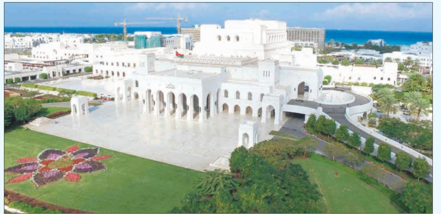
دار الأوبرا السلطانية

وما يزيد من أهمية العلاقات بين البلدين كما يرى د.عدنان الأنصاري أن جلالة السلطان المعظم وسمو أمير الكويت الشقيقة متفقان في إيمانهم العميق بالسلام وبضرورة حل الخلافات بالطرق السلمية وغير الحوار البناء والالتزام الواضح والتعاون وبأسس وقواعد التعامل الدولي وفي مقدمتها حسن الجوار، والتعاون بحسن نية لتحقيق المصالح المشتركة والمتبادلة وعدم التدخل في الشؤون الداخلية للدول الأخرى تحت