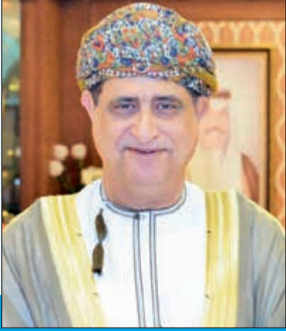
سفير سلطنة عمان لدى الكويت عدنان بن احمد الانصاري

أي ظروف أو مبررات لتتمكن دول وشعوب المنطقة جميعها من بناء حياتها وحاضرها ومستقبلها وفق ما تراه مناسبا لها، وحسب خياراتها الحرة.. ونظرا لأن هذه مبادئ وأسس لا خلاف عليها وتؤديها كل الشعوب والمواثيق الدولية والإقليمية، فإن ترجمتها إلى خطوات عملية ملموسة في علاقات دول المنطقة جميعها، من شأنه أن يسهم في التقريب بينها وتيسير التوصل إلى توافق فيما بينها حول مختلف القضايا والتطورات، سواء القائمة أو المحتملة، ومن ثم تحقيق مصالحها المشتركة والمتبادلة وزيادة قدرتها الفردية والجماعية لمواجهة أي مخاطر أو تهديدات قائمة أو محتملة بفعل ما يجري في المنطقة ومن حولها من تطورات وتغيرات لابد أن يضعها الجميع في اعتبارها.