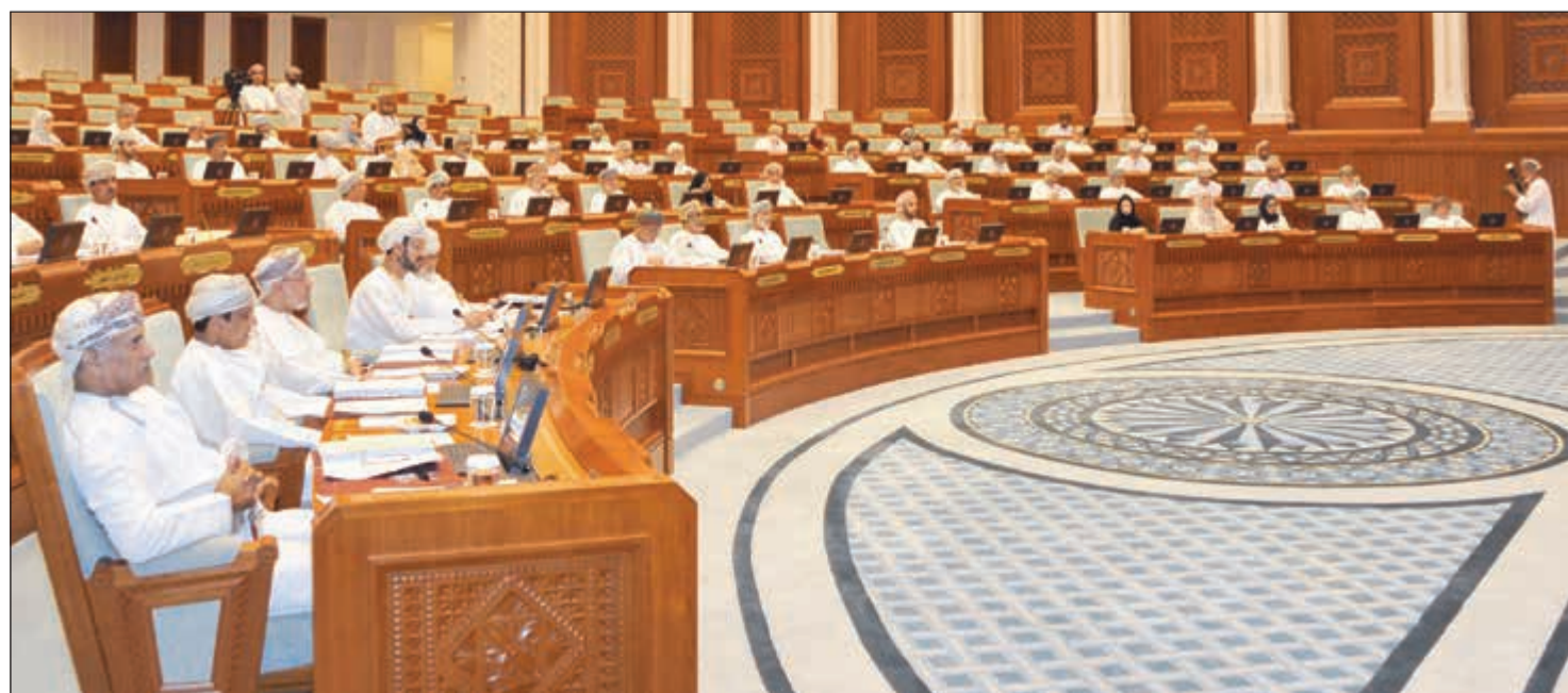
جانب من جلسات مجلس الدولة في دور الانعقاد السنوي الرابع من الفترة السادسة

التنسيق والتعاون بين السلطين التشريعية والتنفيذية إحدى سمات الشورى العمانية