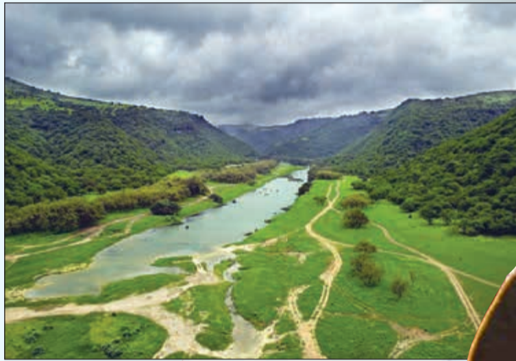
وادي دريات في صلالة