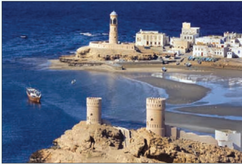
منظر خلّاب من ولاية صور